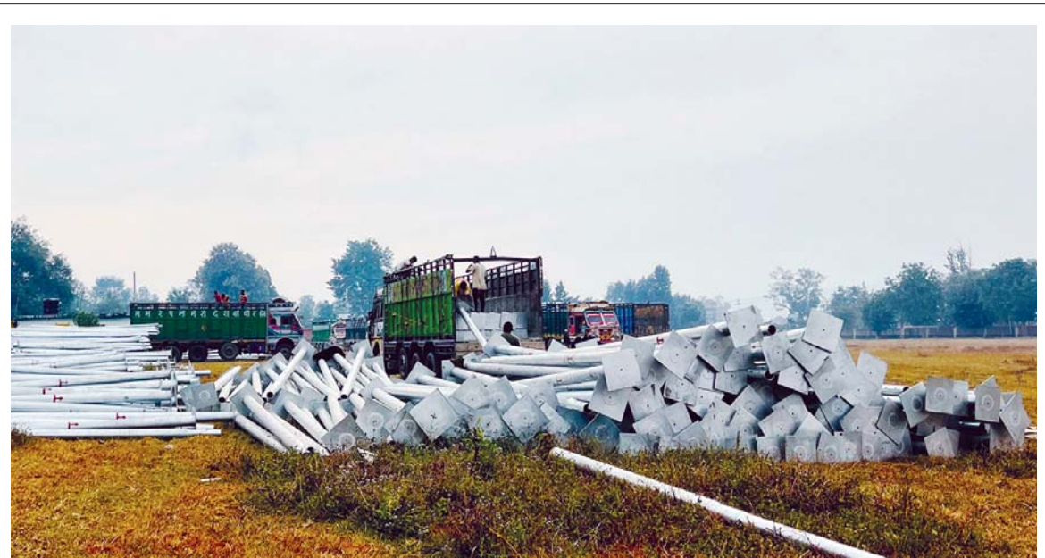
विद्युतका सम्बन्धमा नेपाल विद्युत् प्राधिकरण कर्णाली प्रदेशले सुर्खेतका विभिन्न ठाउँमा विद्युतीकरण गर्नका लागि वीरेन्द्रनगर नगरपालिकाको खुल्ला