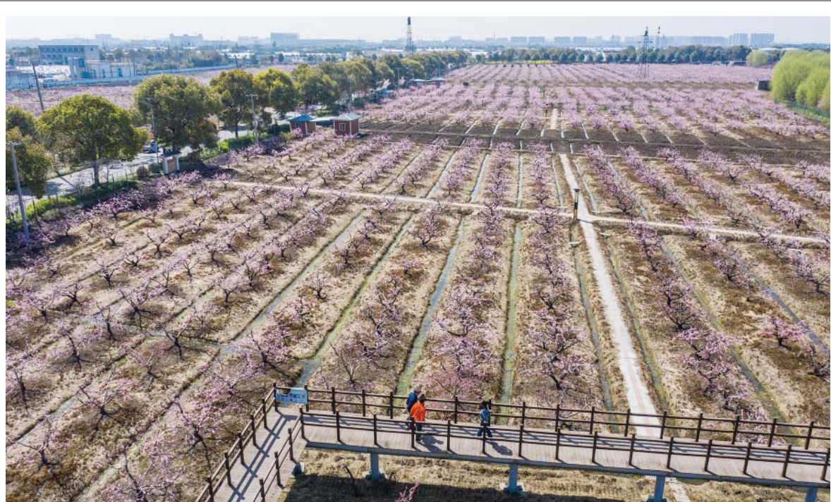
आरू पूर्वी चीनको भोजियाउ प्रान्तको जियाक्सिड काउन्टीको याओफुआउ टाउनको वेइहे गाउँस्थित आरूका फूलले मनमोहक बगैँचाको फुलेपछि डिनबाट लिइएको तस्वीर।