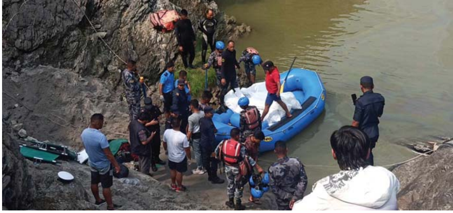
ट्याक्सी खसेर दुर्घटना भएपछि त्रिशूलीमा डुबेका यात्रुका शव निकाल्दै सुरक्षाकर्मीसहितको उद्धार टोली।

काठमाडौंबाट गोरखा फर्किदै गरेको एकै परिवारका पाँच जनाको मृत्यु, ट्याक्सी त्रिशूलीमा खसेर दुर्घटना