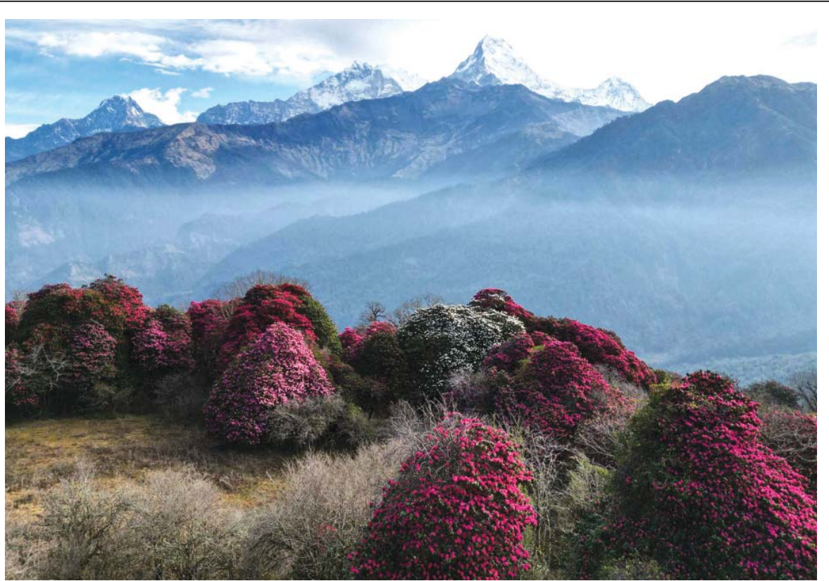
सुन्दर म्याग्दीको अन्नपूर्ण-६ घोडेपानीको जंगलमा फुलेको लालीगुराँस र पृष्ठभूमिमा रहेको अन्नपूर्ण हिमालको मंगलबार बिहान देखिएको लालीगुराँस। गुराँसको जंगल र हिमशृङ्खलाको सौन्दर्यमा राम्रान घोडेपानी उपयुक्त गन्तव्य हो।