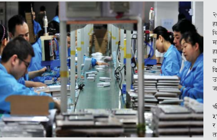
गिरिहेका छन्। चीनले आफ्नो ऋणमा ढुवको रिथल स्टेट बजारमा संकटको सामना गरिरहेको छ। हालैका महिनाहरूमा घरेको मूल्यमा गिरावट आएको छ भने खुद्रा विक्री खराब घरेलु मागबाट प्रभावित भएको छ।

बेइजिङ- चीनको कारखाना गतिविधि अप्रिलमा लगातार दोस्रो महिना बढेको छ। मंगलबारको तथ्यांकले कमजोर घरेलु माग र खराब रिथल स्टेट क्षेत्रसामु विशाल अर्थतन्त्रलाई गति दिन संघर्ष गरिरहेका अधिकारीहरूलाई केही राम्रो समाचार प्रदान गरेको छ।