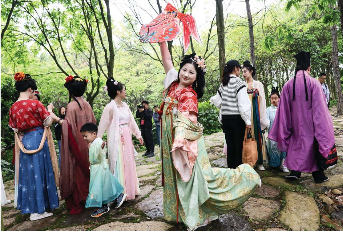
पूर्वी चीनको भोजियाड प्रान्तको जियाक्सिड सहरमा रहेको वनस्पति उद्यानमा परम्परागत हानफु पहिरन लगाएका पर्यटकहरू। हालै जियाक्सिड बोटानिकल गार्डनले नवीकरणको नयाँ चरण पूरा गरेसँगै धेरै पर्यटकहरूलाई आकर्षित गरेको छ।