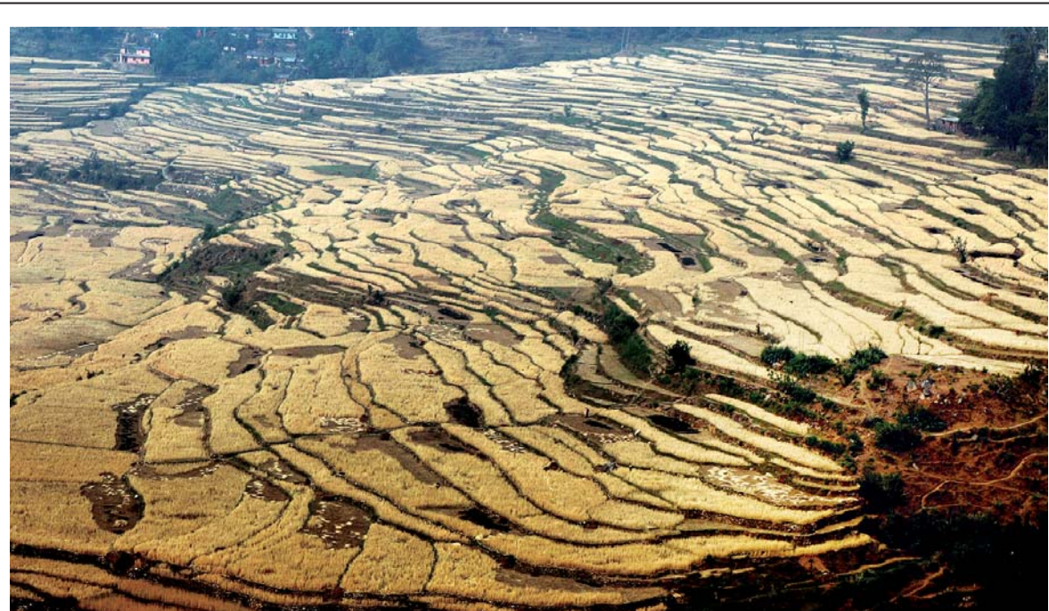
पहलेपुर गहुँबाली | बैतडी जिल्लाको पाटन नगरपालिकामा पाकेर पहिलेपुर भएको गहुँबाली ।