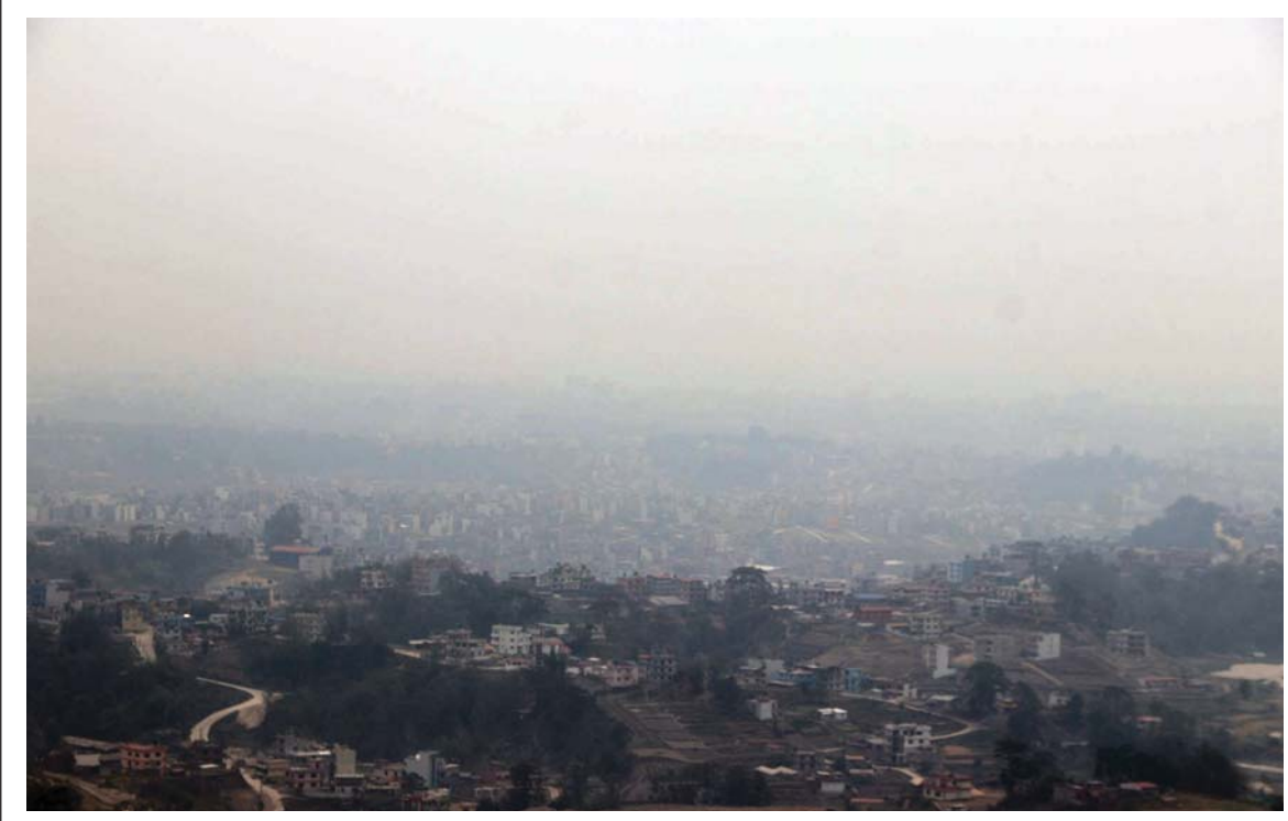
काठमाडौं तारकेश्वर नगरपालिका-२ स्थित काभ्रेस्थलीबाट शनिवार दिउँसो देखिएको काठमाडौं उपत्यका दृश्य। वायु प्रदूषण उच्च बन्दामा पुगेपछि काठमाडौं विश्वकै प्रदूषित सहर बनेको छ।

वर्ष ११ अंक १३ काठमाडौं आइतबार, २३ वैशाख २०८१ Prabhav National Daily Sunday, May 05, 2024 www.prabhavonline.com पृष्ठ ८ मूल्य रु. ५१-