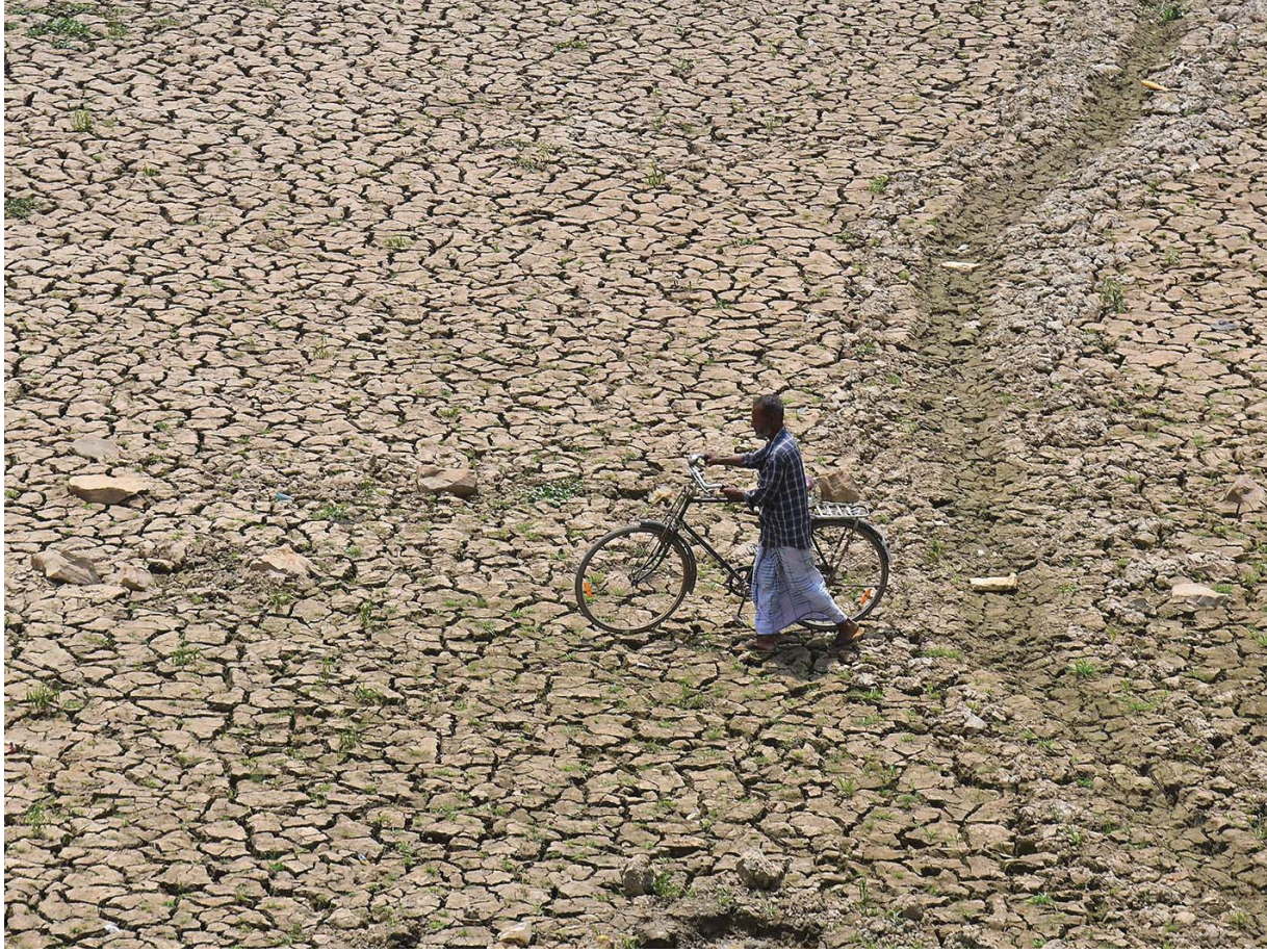
भारतको उत्तरपूर्वी राज्य आसामको नगाउँ जिल्लाको काथियाटोली सहर नजिकैको बोकलुड गाउँमा ताल सुक्ने सुखा बनेको जमिनमाथि साइकल लिएर हिँड्दै एक व्यक्ति ।