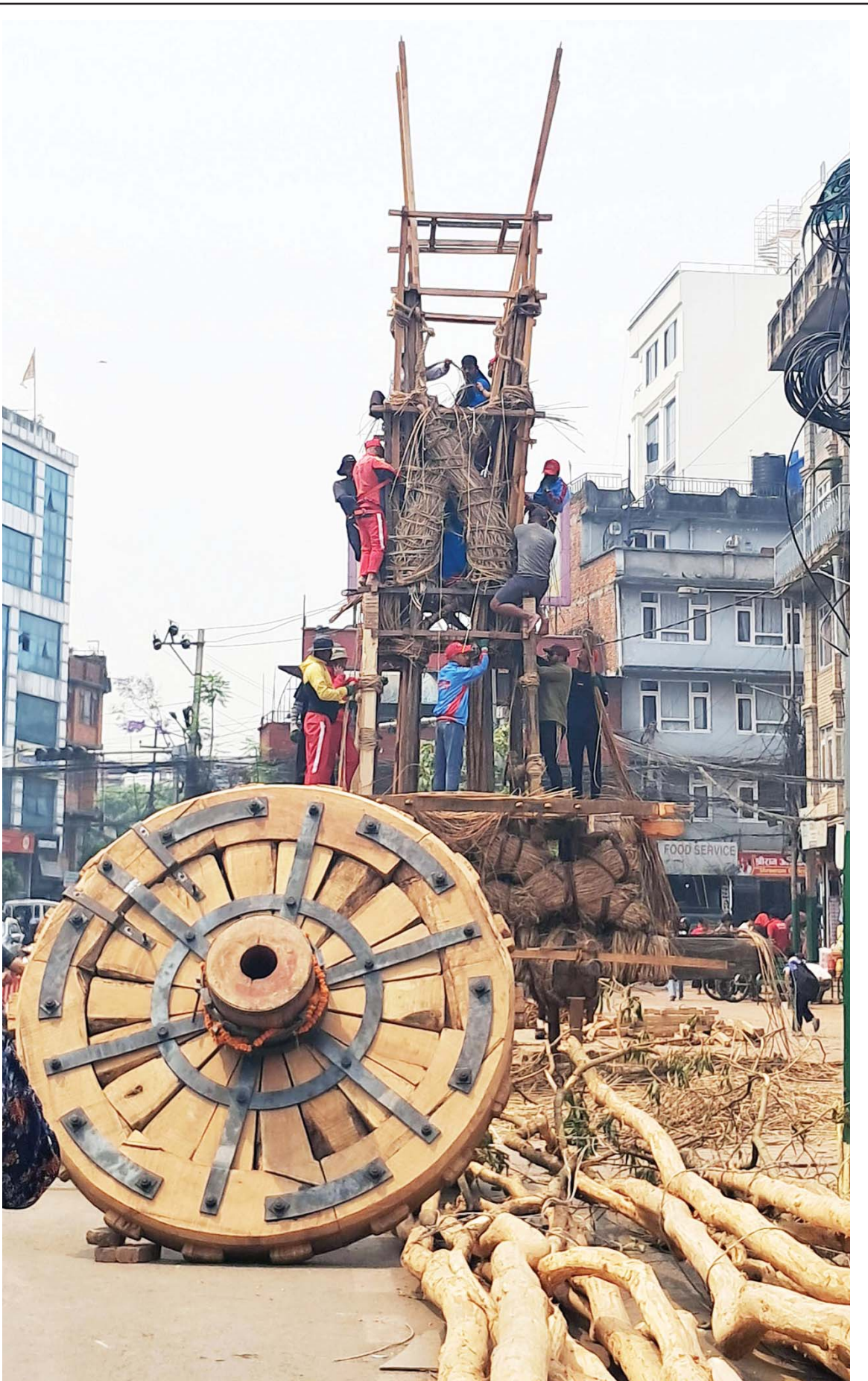
रथयात्राको ललितपुरको फुल्चोकमा ऐतिहासिक रातो मच्छिन्द्रनाथको रथ बनाउँदै स्थानीय । रातो मच्छिन्द्रनाथको रथयात्रा वैशाख महिनाको शुक्लपक्ष प्रतिपदादेखि सुरु भएर असार शुक्ल चौथिसम्म मनाइन्छ ।

पुनर्निर्माणको अनुदान तीन किस्तामा सक्ने र तीन समूहमा विभाजन गर्ने कार्यविधि तयार पारिएको छ । समूह 'क' का लागि पाँच लाख, समूह 'ख' मा परेका लाभग्राहीका लागि चार लाख र समूह 'ग' मा परेका लाभग्राहीलाई तीन लाख अनुदान दिइने छ । पुनःस्थापनाको हकमा घडेरी खरिद गर्न बढीमा तीन लाख दिइने छ । घर निर्माणका लागि सरकारी विक्री मूल्यको ९० प्रतिशत छुटमा ४० क्युफिट काठ उपलब्ध गराइने जनाइएको छ ।