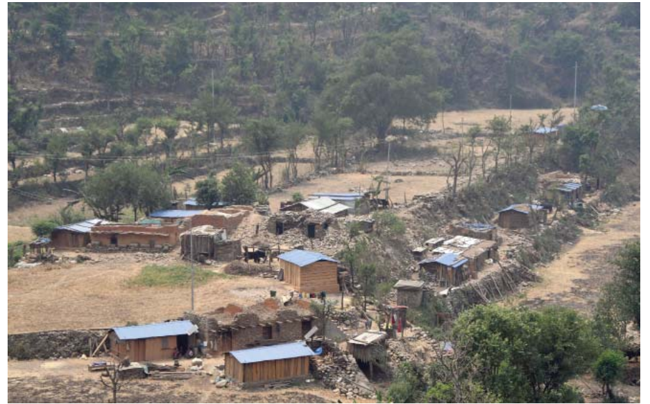
जाजरकोटको भेरी नगरपालिका-१ र नलगाड नगरपालिका-१ को सिमानास्थित भूकम्पप्रभावित गाउँ ठूला बगर ।