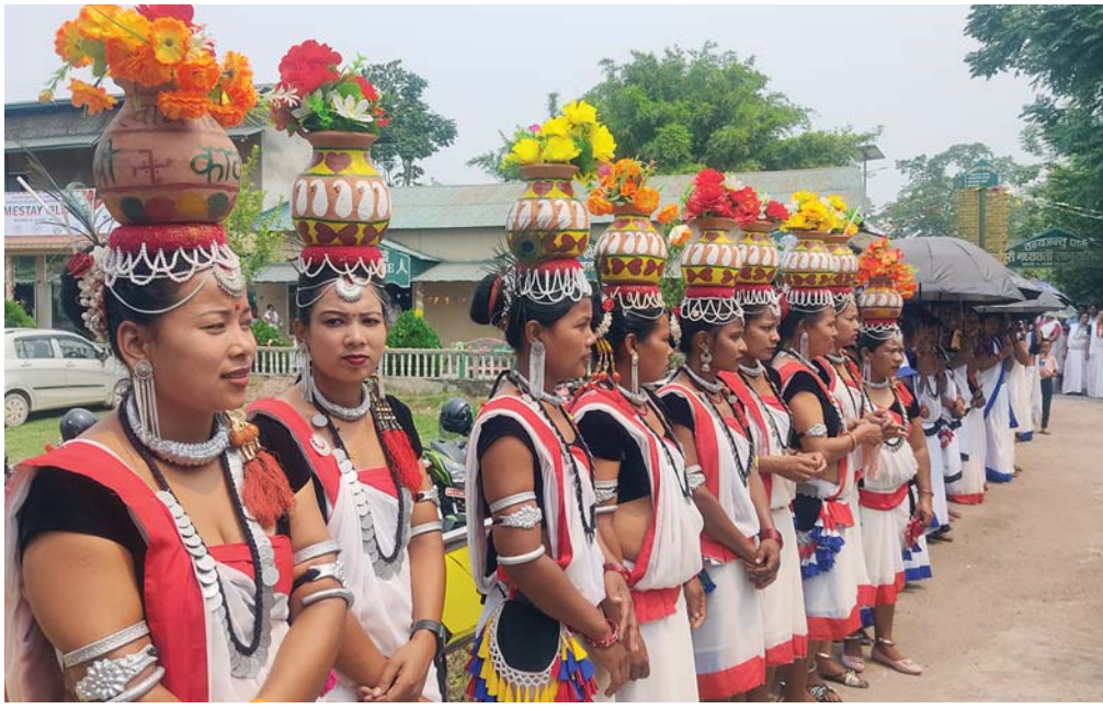
पाहुनाको स्वागत | नवलपुरको अमलटारी घरबास गाउँमा थारु समुदायको वेष्भूषामा सजिएर पाहुनाको स्वागतमा बसेका महिलाहरू ।