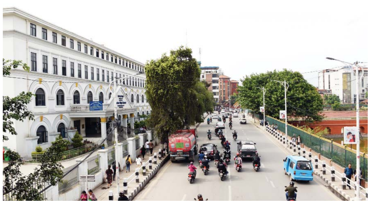
दरबार हाईस्कूल | काठमाडौंको जमलस्थित देशकै पुरानो विद्यालय दरबार हाईस्कूल। २०७२ सालको भूकम्पले क्षति पुऱ्याएको यस विद्यालय चीन सरकारको आर्थिक तथा प्राविधिक सहयोगमा पुनर्निर्माण गरिएको हो।