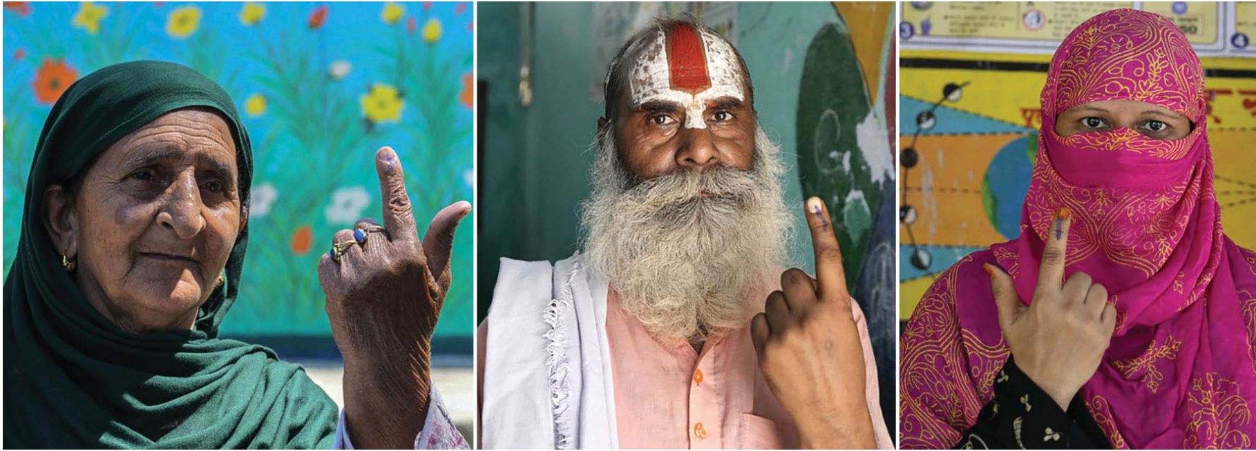
भारतमा जारी आम चुनावअन्तर्गत सोमबार अयोध्यामा सम्पन्न पाँचौं चरणको मतदानमा मत खसालेपछि औलामा लगाइएको मसीको निशान देखाउँदै मतदाता ।