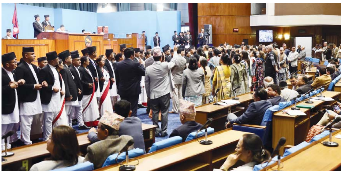
सोमबार चौथोपटक संसद्बाट विश्वासको मत पाएपछि प्रधानमन्त्री पुष्पकमल दाहाल (बाँया) र प्रधानमन्त्रीले विश्वासको मत लिनेक्रममा नाराबाजी गर्दै नेपाली कांग्रेससहित विपक्षी दलका सांसदहरू ।

सरकारले तानाशाही प्रवृत्ति देखायो । बलमिच्याई गन्यो । दुःखदायी घटना सरकारले प्रतिनिधिसभामा मञ्चन गरेको छ । विपक्षीलाई बोल्नै नदिने । संघीय संसद्लाई ब्यारेकजस्तै बनायो । यो खेदजन्य छ ।