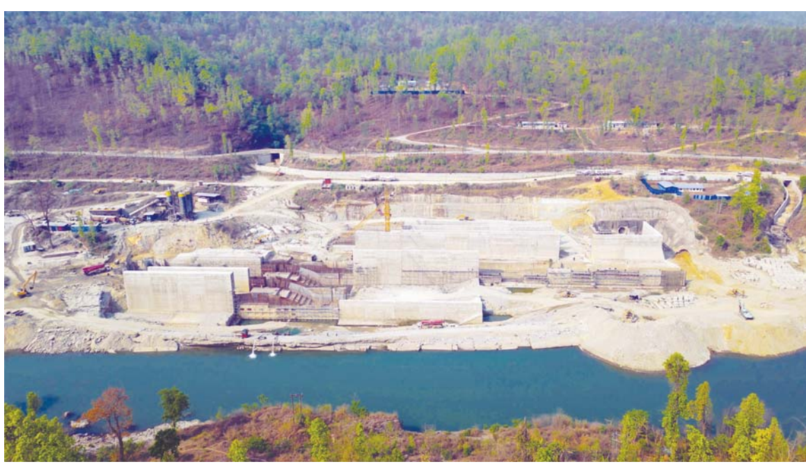
मेरी बर्बड डाइजर्सन सुर्खेतको मेरीगंगा-११ चिप्लेमा निर्माणाधीन मेरी बर्बड डाइजर्सन बहुउद्देश्यीय आयोजनाको ड्र्याम। ३३ अर्ब १९ करोड ६६ लाखमा निर्माण भइरहेको राष्ट्रिय गौरवको यो आयोजनाको ६५ प्रतिशत काम सम्पन्न भएको छ।