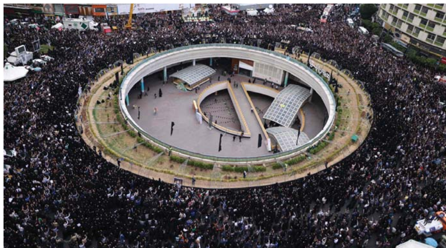
हेलिकप्टर दुर्घटनामा परी मृत्यु भएका इरानी राष्ट्रपति इब्राहिम रायसी र विदेशमन्त्री होसेन अमिर-अब्दुल्लाहियानप्रति श्रद्धाञ्जली अर्पण गर्न मध्य तेहरानको भलियासर स्क्वायरमा भेला भएका इरानीहरू।

तेहरानको ग्रान्ड मोसल्लाह मस्जिदमा आज बुधबार ठूलो समारोह आयोजना गरिएको छ। त्यसपछि राष्ट्रपति रायसीको पार्थिव शरीरलाई मशहदको ऐतिहासिक इमाम रेजा मन्दिरेमा सारिने छ जहाँ इरानका सर्वोच्च नेता आयातोल्लाह खमेनीले प्रार्थना गर्ने छन्। खमेनीले सोमबार पाँच दिनको शोकको घोषणा गरेका