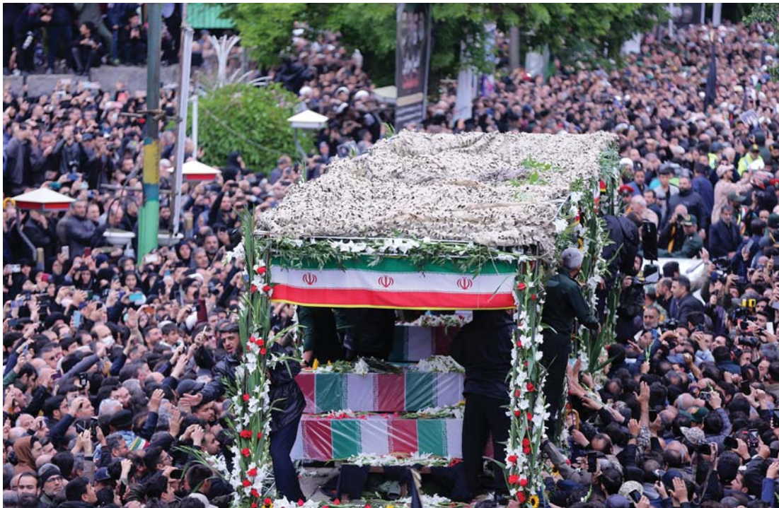
इरानका विरुद्ध राष्ट्रपति इब्राहिम रायसी, विदेशमन्त्री होसेन अमिर-अब्दुल्लाहियानसँगै हेलिकप्टर दुर्घटनामा परी मृत्यु भएकाहरूका लागि इरानको तब्रिजमा बिहीबार आयोजित विदाइ समारोहमा उपस्थित मानिसहरू। आइतबार हेलिकप्टर दुर्घटनामा मृत्यु भएको उनीहरूको बिहीवार अन्त्येष्टि गरिएको छ।