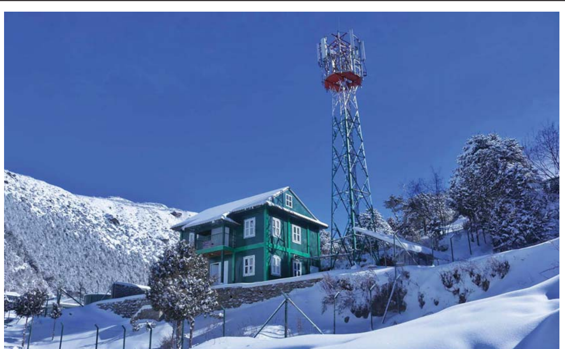
टेलिकमको सोलुखुम्बु, नाम्चेस्थित नेपाल टेलिकमको फोरजी टावर र कार्यालय।