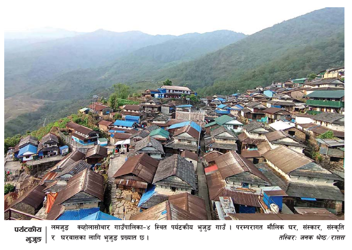
पर्यटकीय भुजुङ लमजुङ क्वोलासोथार गाउँपालिका-४ स्थित पर्यटकीय भुजुङ गाउँ। परम्परागत मौलिक घर, संस्कार, संस्कृति र घरवासका लागि भुजुङ प्रख्यात छ।