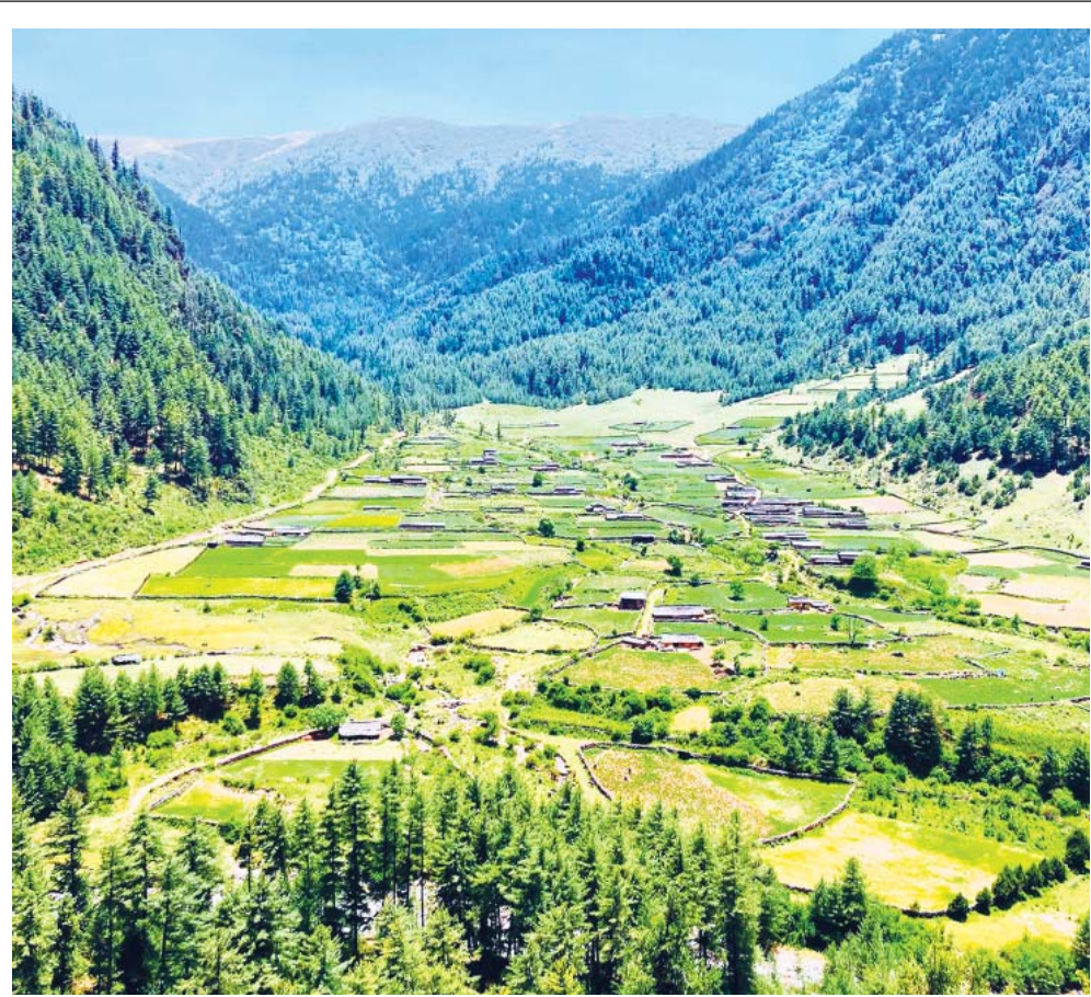
पर्यटकीय बागलुङ जिल्लाको ढोरपाटन नगरपालिका-९ स्थित विकट दिज गाउँ। प्राकृतिक सौन्दर्यताले भरिपूर्ण दिज गाउँ। बागलुङ जिल्लाको ढोरपाटन नगरपालिका-९ स्थित विकट दिज गाउँ। प्राकृतिक सौन्दर्यताले भरिपूर्ण दिज गाउँ। बागलुङ जिल्लाको ढोरपाटन नगरपालिका-९ स्थित विकट दिज गाउँ। प्राकृतिक सौन्दर्यताले भरिपूर्ण दिज गाउँ।