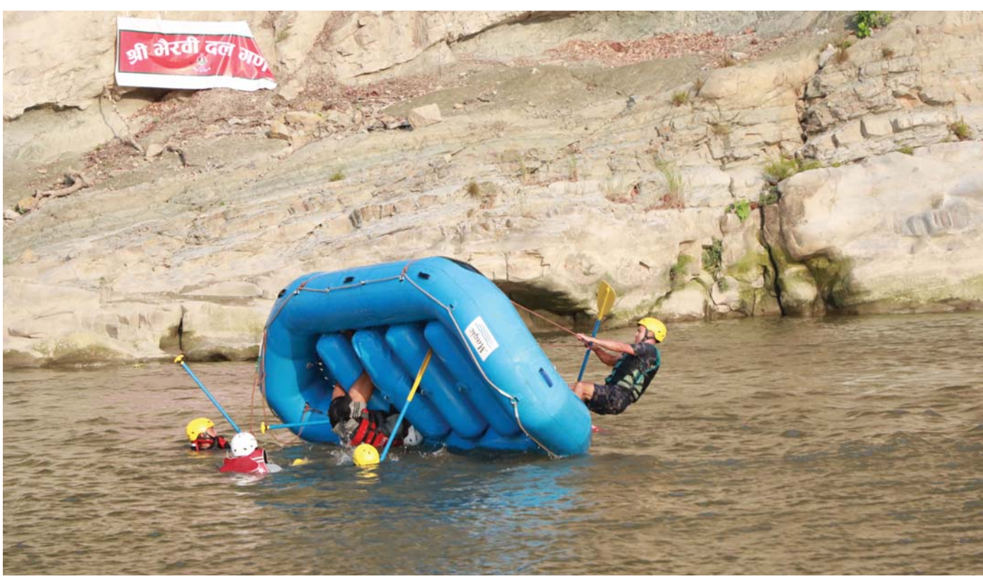
जल उद्धारको कृत्रिम अभ्यास नेपाली सेनाको भैरवी दल गण पाँच कुमारीले सलही र रौतहटको सिमाना नुनथरस्थित बागमती नदीमा शुक्रवार जल उद्धारको कृत्रिम अभ्यास गर्दै। नेपाली सेना, नेपाल प्रहरी र सशस्त्र प्रहरीको संयुक्त टोली।