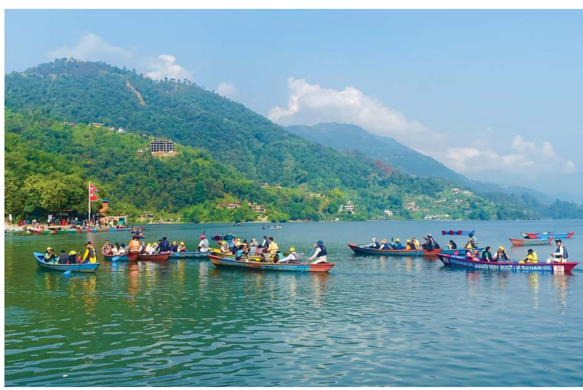
फेवातालमा साईली... पर्यटकीय राजधानी पोखरास्थित फेवातालमा सोमबार बिहान ढुंगा सयर गर्ने पर्यटक। यो याममा पोखरामा भारतीय पर्यटकको चहलपहल बढेको छ।