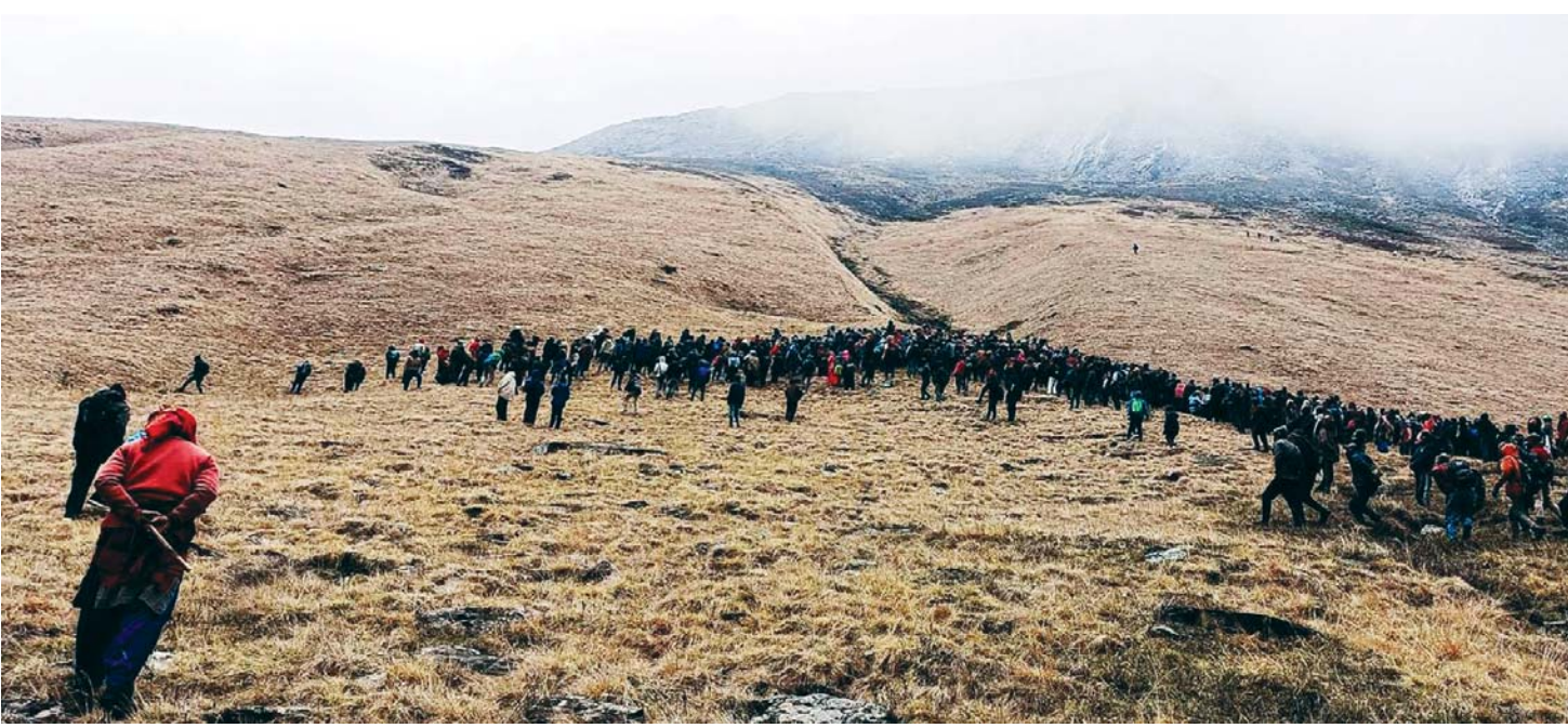
यासागुम्बाको खोजी डोल्पाको ठूलीभेरी नगरपालिका-११ ग्यालवाडाको पाटनमा यासागुम्बा टिप्न जाँदै स्थानीय वासिन्दा।

वर्ष ११ अंक ४८ काठमाडौं आइतबार, २७ जेठ २०८१ Prabhav National Daily Sunday, June 9, 2024 www.prabhavonline.com पृष्ठ ८ मूल्य रु. ५१-