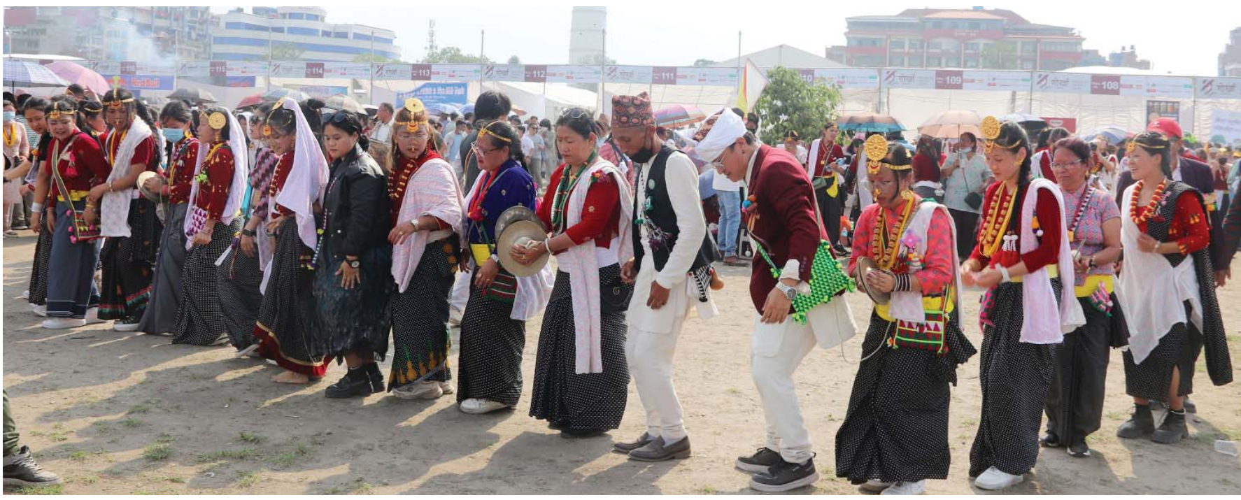
साकेला सिली नाच किराँत राई यायोखा, काठमाडौँद्वारा शनिवार टुँडिखेलमा आयोजित किराँत समुदायको प्रमुख चाड साकेला (उभौली)का अवसरमा परम्परागत वेशभूषामा सजिएर गोले घेरामा ढोल र भ्रुचाम्टा बजाउँदै साकेला सिली नाच प्रस्तुत गर्दै ।