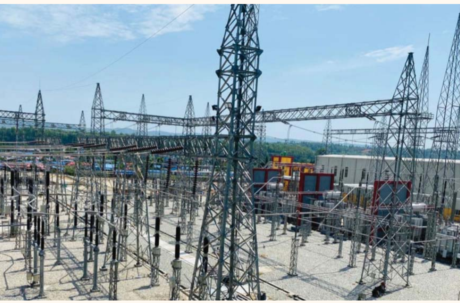
पश्चिम पनि चार हजार मेगावाट विद्युत् प्रवाह गर्न सकिने हुँदा आन्तरिकरूपमा विद्युत् आपूर्ति थप सुदृढ हुने र भारतसँगको विद्युत् व्यापार थप विस्तार हुने छ। आयोजनाअन्तर्गत ढल्केवर-इनरुवा खण्ड निर्माण सम्पन्न हुने लागेको छ। हेटौंडा-ढल्केवर खण्ड निर्माणमाथीन छ। हेटौंडा उपमहानगरपालिकाका १५,

काठमाडौं- भण्डै चार हजार मेगावाट विद्युत् प्रवाह गर्ने क्षमता भएको ४०० केभी क्षमताको हेटौंडा सबस्टेसन निर्माण सम्पन्न भएको छ। देशभित्रको विद्युत् प्रसारण तथा वितरण प्रणाली सुदृढीकरण तथा विस्तारका लागि मकवानपुरको हेटौंडा उपमहानगरपालिका-११ थानाभन्दाथामा सो सबस्टेसन निर्माण भएको हो। र्यास इन्सुलेटेड प्रणाली (जिआइएस) प्रविधिमा आधारित स्वचालित नेपालको तेस्रो ठूलो ४०० केभी हेटौंडा सबस्टेसन निर्माण सम्पन्न गरी शुक्रबार साँझदेखि सञ्चालन (चार्ज)मा ल्याइएको छ। यसैगरी, नेपाल-भारत विद्युत् प्रसारण तथा व्यापार आयोजनाबाट थानाभन्दाथामा नै २२० र १३२/११ केभी क्षमताका सबस्टेसन निर्माण सम्पन्न गरी शुक्रबार नै चार्ज गरिएको छ। मुलुकभित्रको पूर्व-पश्चिम विद्युत् आपूर्तिलाई भरपर्दो तथा गुणस्तरीय बनाउन र भारतसँगको विद्युत् व्यापारका लागि निर्माण गरिएको जिआइएस प्रविधियुक्त स्वचालित ढल्केवर मुलुककै पहिलो, इनरुवा दोस्रो र हेटौंडा तेस्रो ठूलो सबस्टेसन हो। हेटौंडा सबस्टेसनको निर्माण सम्पन्न भएसँगै करिब चार हजार मेगावाट विद्युत् प्रवाह गर्नसक्ने पूर्वाधार संरचना तयार भएको छ। हेटौंडा-ढल्केवर-इनरुवा ४०० केभी प्रसारणलाइन आयोजना निर्माण सम्पन्न भएपछि, ढल्केवरबाट पूर्व-