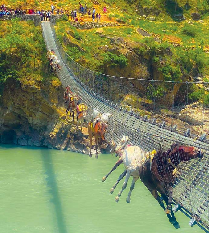
दैलेखको आठबिस नगरपालिका-४ खिडकीज्यूला र अछामको पञ्चदेवल नगरपालिका जोड्ने कर्णाली नदीमाथिको भोलुगे पुलको लडा बुँडिवा फसेका खच्चडहरू। आइतबार बिहान पुलको छेउको जालीमा फसेका खच्चडहरूको उद्धार गरिएको छ। (विस्तृत समाचार पृष्ठ ५ मा)

वर्ष ११ अंक ४९ काठमाडौं सोमबार, २८ जेठ २०८१ Prabhav National Daily Monday, June 10, 2024 www.prabhavonline.com पृष्ठ ८ मूल्य रु. ५१-