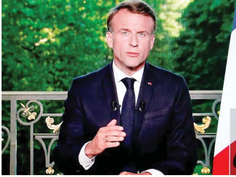
व्यवस्थापिकाको निर्वाचनका लागि २७ देशका ३६ करोडभन्दा बढी युरोपेलीले मतदान गरेका थिए। इयूको अर्को संसद र आयोगले युक्रेनमा रूसको जारी युद्ध, अमेरिका-चीन प्रतिद्वन्द्वताका कारण विश्वव्यापी व्यापार

ब्रसेल्स - युरोपेली संघ (इयू) को चुनावमा अति राष्ट्रवादी (दक्षिणपन्थी) समूहको विजयले फ्रान्समा आइतबार राजनीतिक भुइँचालो निम्त्याएको छ। निर्वाचनसंगै राष्ट्रपति इमानुएल म्याक्रोनले उच्च जोखिमको कदमको संज्ञा दिएका विधायिकाको मध्यावधि निर्वाचनको घोषणा गरेका छन्। मध्यमार्गी मूलधारका दलहरूले युरोपेली संसदमा समग्र बहुमत कायम राखे पनि समग्र परिणाममा अति दक्षिणपन्थी दलहरूको सुधार देखिएपछि इयूको राजनीति तरंगित भएको छ। अति राष्ट्रवादी समूह फ्रान्स, इटाली र अस्ट्रियामा पहिलो तथा जर्मनी र नेदरल्याण्ड्समा दोस्रो भएको प्रारम्भिक नतिजाले देखाएको छ। युरोपेली आयोगकी अध्यक्ष उर्सुला भोन डेर लेयेनले भनिनु, 'हामी बायाँ र दायाँबाट अतिवादीहरूको विरुद्धमा किल्ला निर्माण गर्ने छौं।' ७२० सदस्यीय