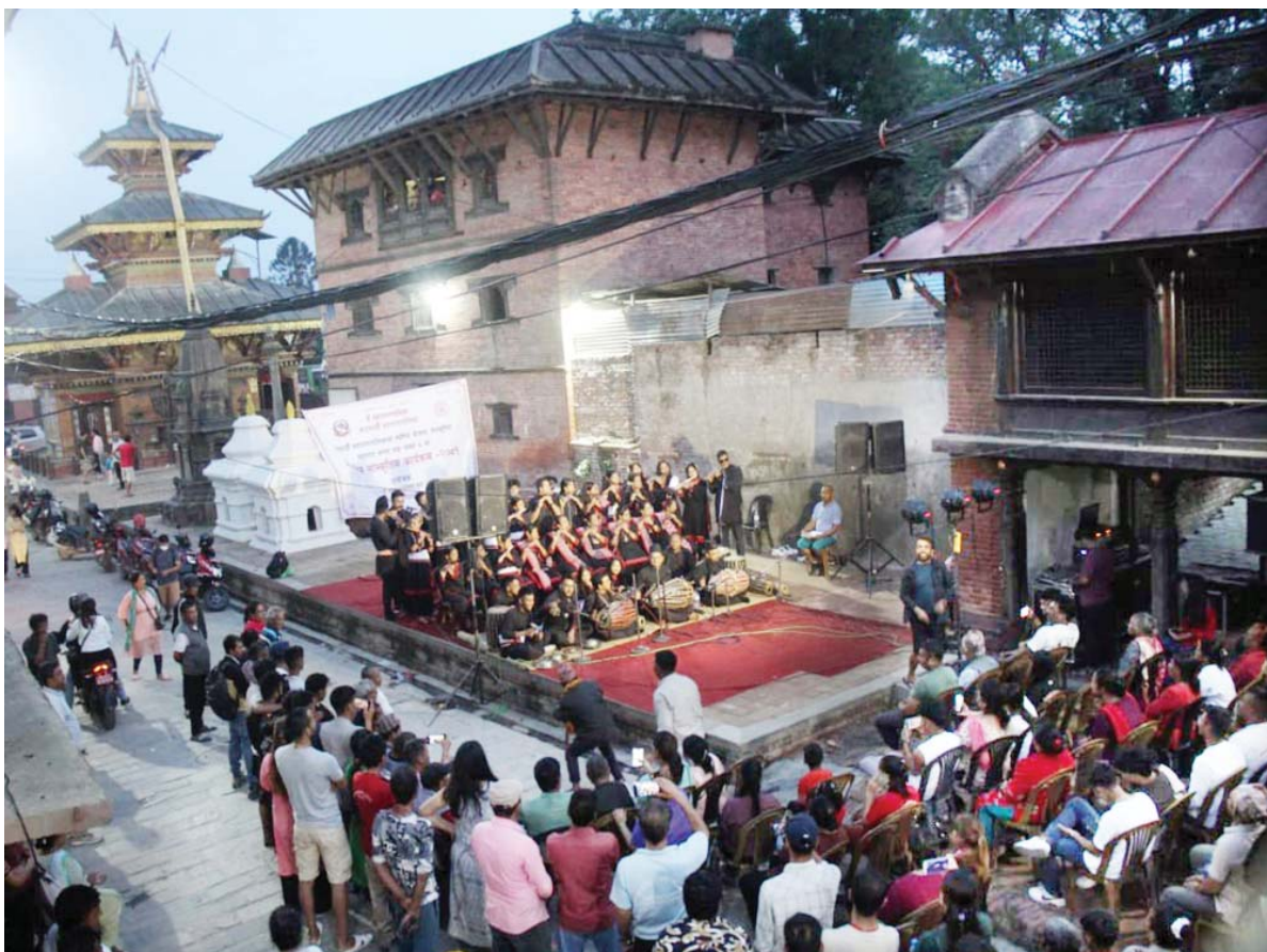
काठमाडौं महानगरपालिकाको स्वर्णिम योजना, सांस्कृतिक महानगरअन्तर्गत वडा नम्बर ८ को जयवागेश्वरी उबलीमा शनिवार साँझ आयोजित साप्ताहिक सांस्कृतिक कार्यक्रममा सहभागी कलाकारहरू।