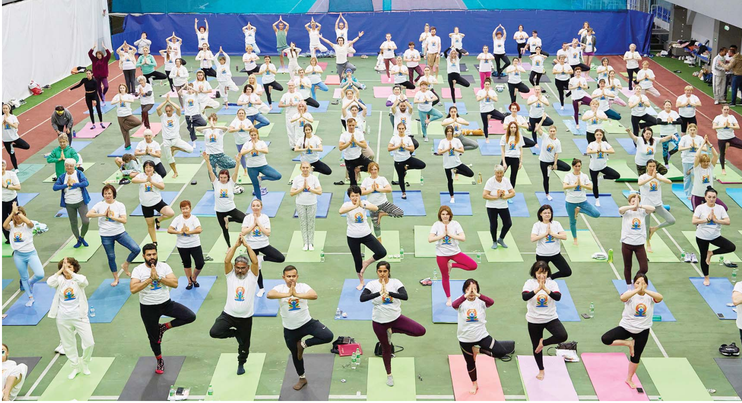
रुसको भ्नादिभोस्तोकमा योगको अभ्यास गर्दै मानिसहरू ।