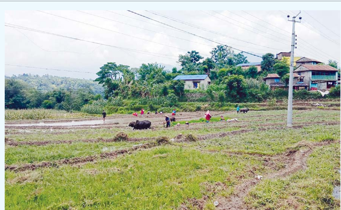
रोपाइको तयारी | तनहुँको भानु नगरपालिका-४ बडहरेमा खेतमा धान रोप्दै किसान। भानु, व्यास, शुक्लागण्डकी नगरपालिका, म्याग्दे र ऋषिङ गाउँपालिका धान पकेट क्षेत्र हुन्।