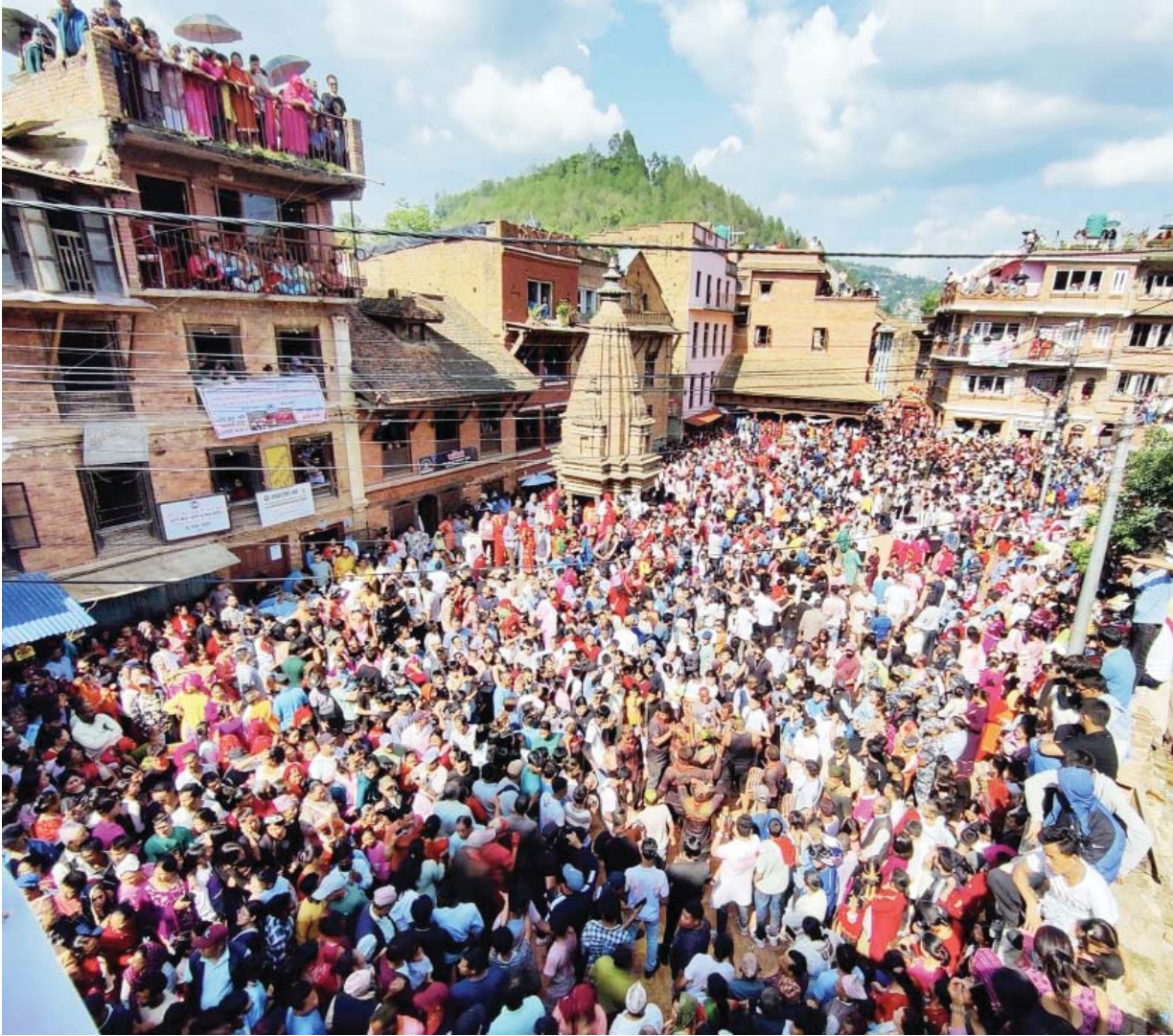
पलौतीको हिलेजात्रा काभ्रेपलाञ्चोकको ऐतिहासिक नगर पनौतीमा तीन दिनदेखि चलेको हिलेजात्रा (ज्या:पुन्ही)मा रथ यात्रा गर्दै स्थानीय । एक हजार ४२० वर्षदेखि मनाइँदै आएको हिलेजात्रा विशेषरूपमा शनिवार परम्परा अनुसार दिनभर बजारमा भद्रकाली, महादेव र इन्द्रेश्वरका तीनवटा रथको भागदौड गराउने र रथ भेटिँदा यिनकता दशाउन दुई रथलाई एक आपसमा जुधाइ जात्रा सम्पन्न गरिएको छ ।