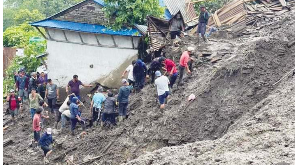
लमजुङको क्वोलासाथार गाउँपालिका-३ वगुमा मंगलबार राति गएको पहिरो।