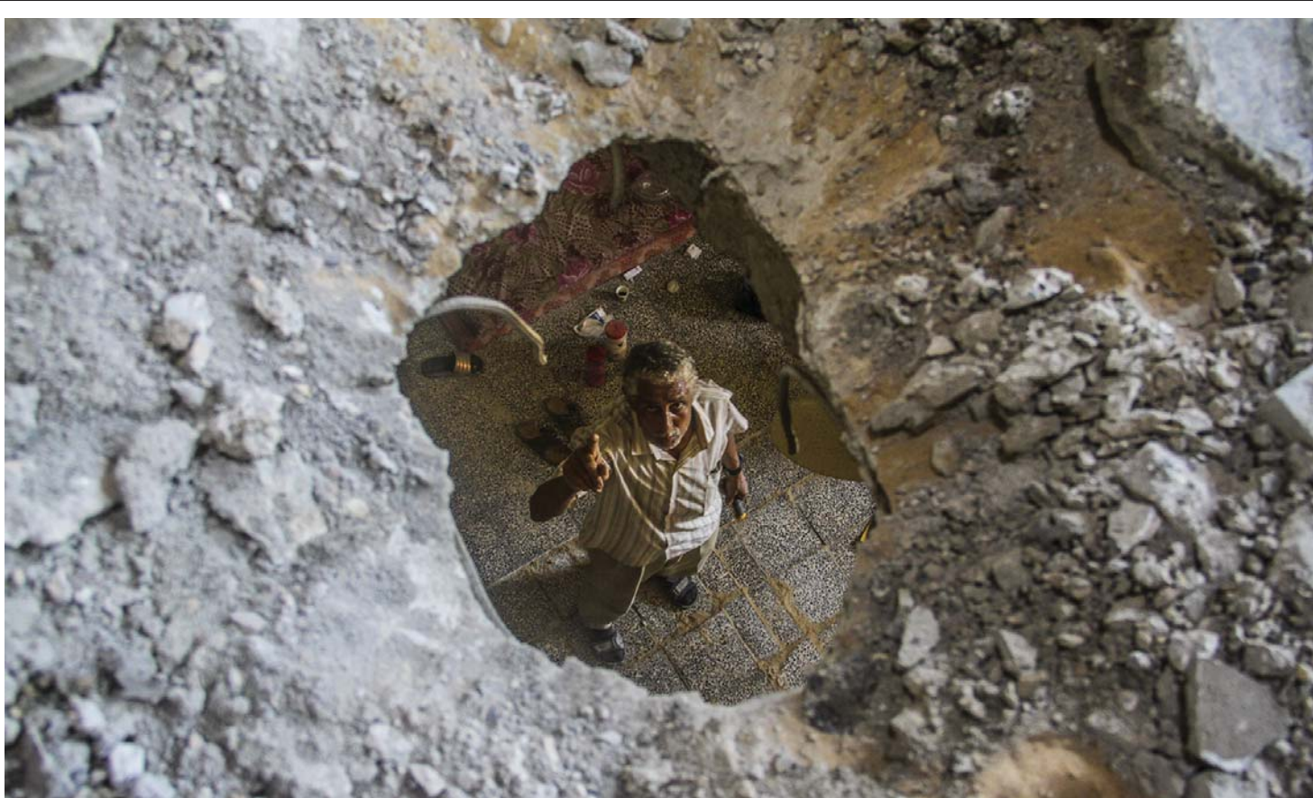
युद्धको कहर | गाजा सहरको पश्चिममा रहेको अल-शाती शरणार्थी शिविरमा इजरायली हवाई हमलाबाट विद्यालयमा भएको क्षतिको निरीक्षण गर्दै एक प्यालेस्टिनी नागरिक।