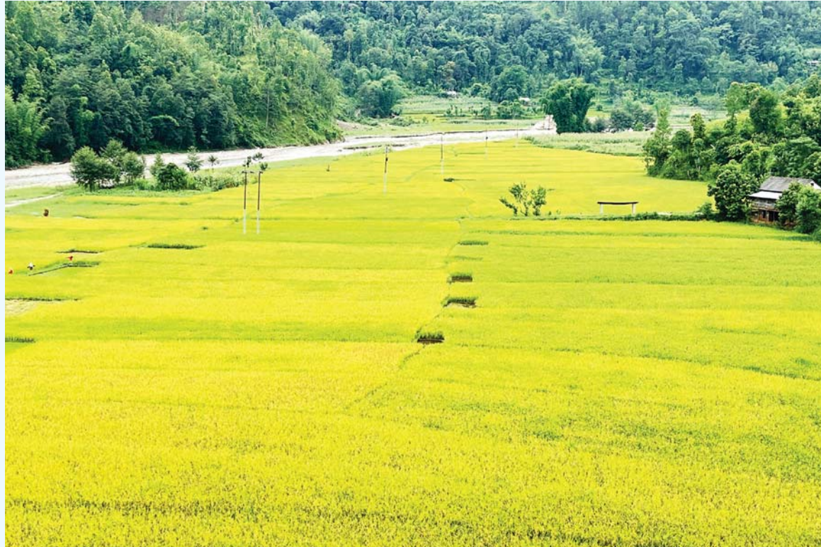
पाकथो | गुल्मीको इस्मा गाउँपालिका-१ अन्तर्गत छल्दी किनारमा पाकई गरेको चैते धान। अब यो धान पाकिसेकेपछि मंसिरे धान लगाउने तयारी किसानहरूले गरेका छन्।