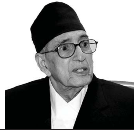
सन्दर्भ : गिरिजाप्रसाद जन्म शताब्दी

पटक गरेर उहाँले १२ वर्षभन्दा बढी समय जेलमा बिताउनुभयो । राणा र शाह दुवै निरंकुशतालाई चुनौती दिँदै कहिल्यै भुक्तुभएन, वरु उहाँको साहस, स्वाभिमान र अडानका अगाडि कुनै पनि अतिवाद वा निरंकुशता भुक्त बाध्य भए । प्रजातन्त्रका सन्दर्भमा कसैसँग पनि सम्झौता नगर्ने र प्रतिनिधिसभाको पुनर्बहालीले मात्र राजनीतिक विकास दिनसक्छ भन्ने गिरिजाबाबुको अडानलाई २०६१ साल माघ १९ को राजा ज्ञानेन्द्रको कदमले पनि रोक्न सकेन । २०५९ साल असोज १८ मा तत्कालीन राजा ज्ञानेन्द्र शाहले जननिर्वाचित प्रधानमन्त्री शेरबहादुर देउवालाई