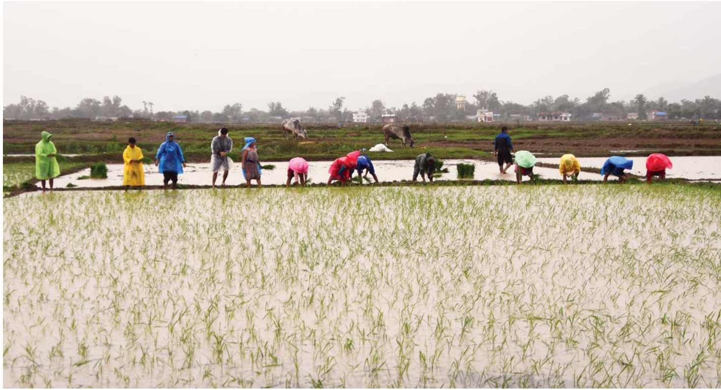
दाङको घोराही उपमहानगरपालिका-७ स्थित सौंदर्यारका किसान शुक्रवार भरीमा प्लास्टिक ओडेर धान रोपाईं गर्दै। दाङमा शुक्रवारसम्म १५ प्रतिशत रोपाईं सकिएको कृषि ज्ञान केन्द्र दाङका सूचना अधिकारी पृथ्वीराज लामिछानेको भनाइ छ।

प्रभाव पब्लिकेशन प्रा. लि. सिफल-७, काठमाडौं ०१४३७३७७ / ९७६११५४००० ९८४११५११७ / ९८४१२४६२६९ marketing2prabhav@gmail.com