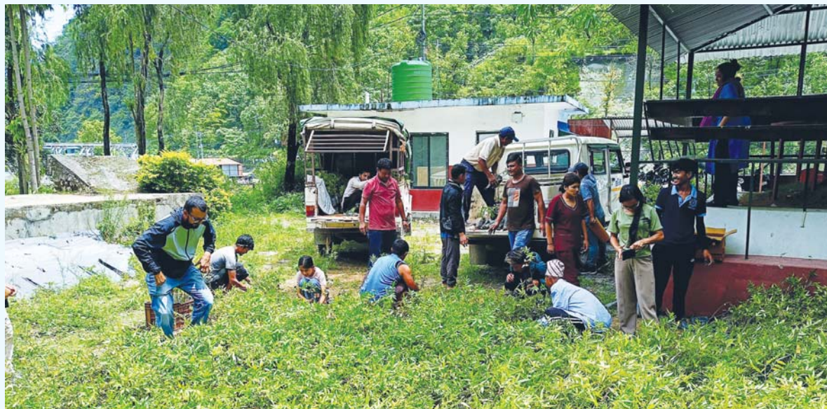
टिम्पुरका बिस्वा | बेनीस्थित डिभिजन वन कार्यालय परिसरमा मसला र जडीबुटीको रुपमा प्रयोग हुने टिम्पुरको बिस्वा वितरण गरिँदै ।