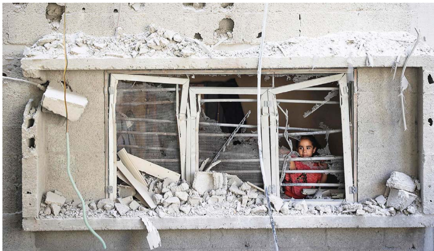
मध्य गाजा पट्टीको नुसरात शरणार्थी शिविरमा इजरायली हमलामा क्षतिग्रस्त भवनको फ्यालबाट बाहिर हेर्दै एक प्यालेस्टाइनकी बालिका ।