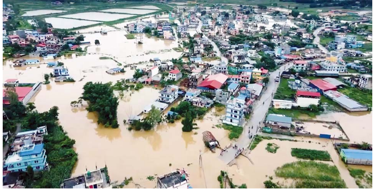
डोनबाट खिचिएको मकवानपुरको हेटौडा उपमहानगरपालिका-५ स्थित शान्तिनगरमा भएको डुबान। अविरल वर्षाले सिँचाइटोल, शान्तिनगर, पिप्ले, कर्ना क्षेत्र डुबानमा परेको छ।