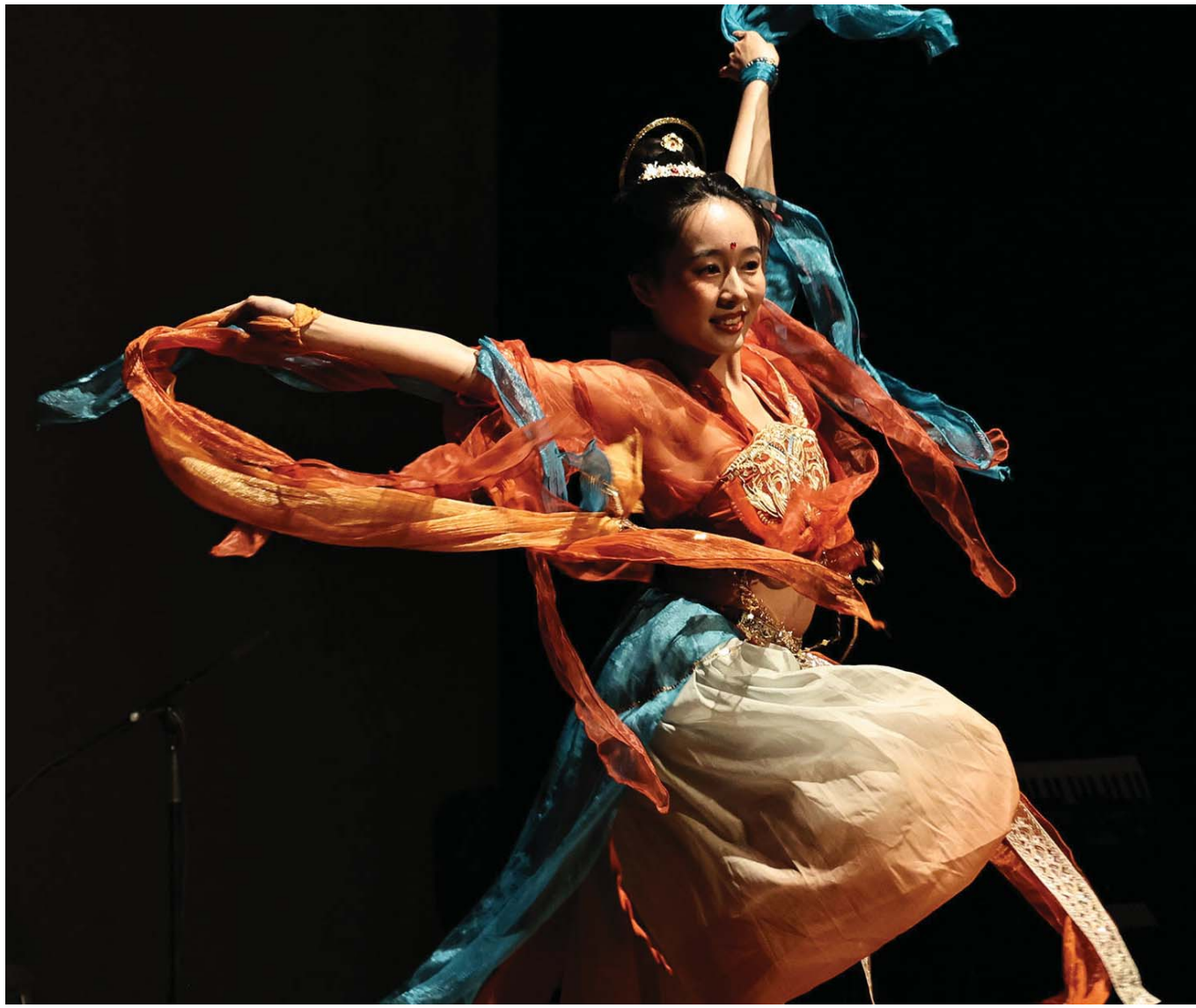
भोरकको राजधानी रवातमा भएको कन्सर्टमा दन्डाङ नृत्य प्रस्तुत गर्दै एक चिनियाँ कलाकार ।