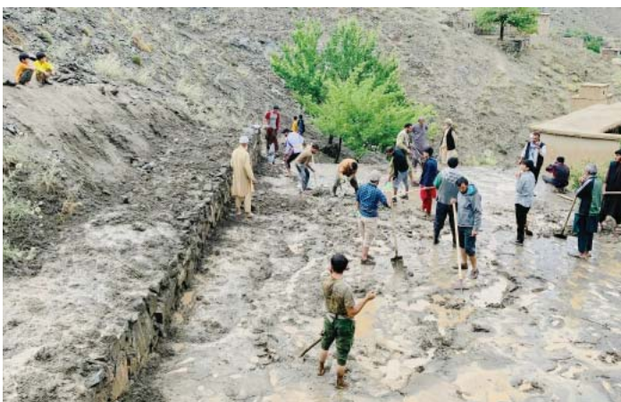
अधिकारीहरूले तथ्यांक अफ वदूनसक्ने बताएको खामा प्रेसले जनाएको छ।

काबुल (अफगानिस्तान) - अफगानिस्तानको जलालाबाद सहर र नंगरहार प्रान्तको छेउछेउका क्षेत्रमा परेको भारी वर्षा र असिनाको कारण ३५ जनाको मृत्यु हुनुका साथै २३० जना घाइते भएको खामा प्रेसले जनाएको छ। नंगरहारको सूचना तथा संस्कृति विभागले नंगरहारका विभिन्न जिल्लामा मानिसको ज्यान गएको पुष्टि गरेको छ। विभागको रिपोर्टअनुसार मृतक तथा घाइतेलाई उद्धार गरी नंगरहार केन्द्रीय तथा प्रान्तीय अस्पतालमा लगिएको छ। प्रारम्भिक रिपोर्टले लगभग ४०० घर ध्वस्त भएको संकेत गरेका छन्, जसले वासिन्दा र व्यवसायलाई आर्थिक क्षति पुऱ्याएको छ। यद्यपि, स्थानीय