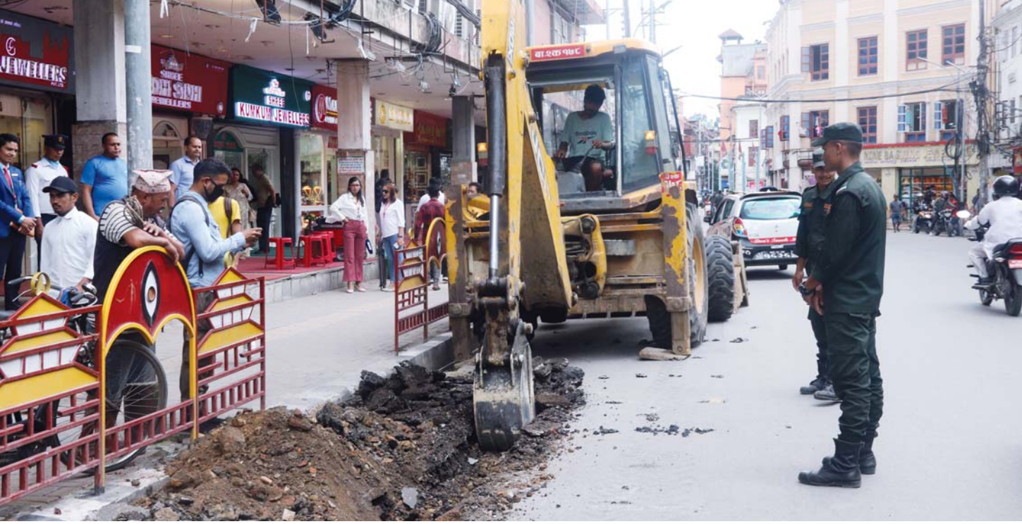
न्यूरोड क्षेत्रमा काठमाडौं महानगरपालिकाले बुधवारबाट सुरु गरेको फुटपाथ विस्तार कार्य । यसअघि सडक डिभिजन कार्यालयले रोक्नेपछि महानगर त्यसविरुद्ध उच्च अदालत पाटन पुगेको थियो । उच्चले फुटपाथ विस्तार गर्ने कार्य नरोक्न आदेश दिएसँगै पुनः काम सुरु गरिएको हो ।

वर्ष ११ अंक ८७ काठमाडौं बिहीबार, ३ साउन २०८१ Prabhav National Daily Thursday, July 18, 2024 www.prabhavonline.com पृष्ठ ८ मूल्य रु. ५१-