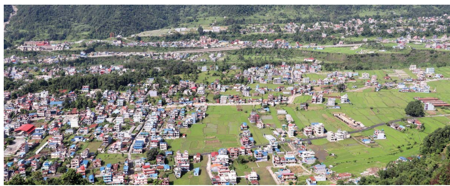
लामाचौर बस्ती | पोखरा महानगरपालिका-१९ स्थित लामाचौरको खेतीयोग्य जमिनमा भरिंदै गएको बस्ती। पछिल्लो समय यस क्षेत्रमा तीव्र सहरीकरण बढेको छ।