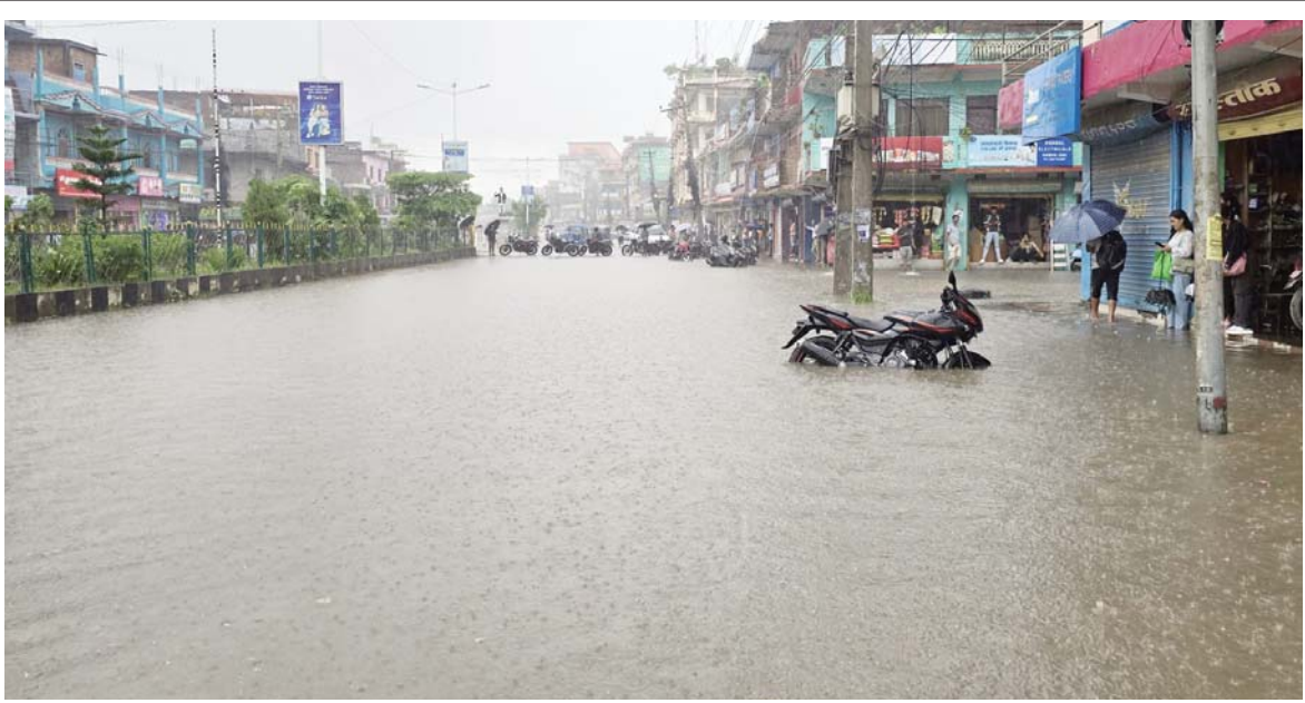
जलमग्न घोराही डलको उचित व्यवस्था नहुँदा मंगलबार दिउँसो परेको पानीले जलमग्न बनेको डाडको घोराही उपमहानगरपालिका-१५ स्थित मुख्यबजार क्षेत्रको सडक।