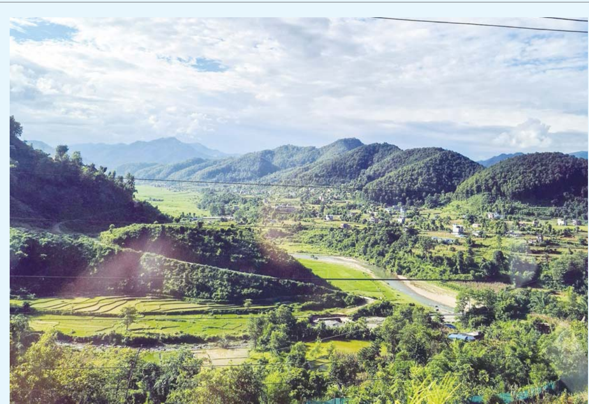
हरियाली फाँट मौसम सफा भएसँगै देखिएको तनहुँको व्यास नगरपालिका-५ स्थित साँगौँटा र पतेनी आसपासका हरियाली दृश्य।