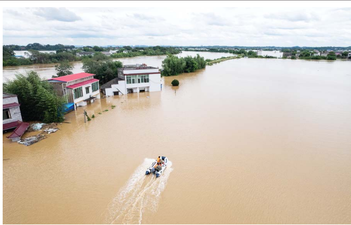
मध्य चीनको हुनान प्रान्तको सियाङटान काउन्टीस्थित यिसुहे टाउनमा बाढीबाट प्रभावित बासिन्दाहरूको खोजी गर्दै उद्धारकर्ताहरू ।