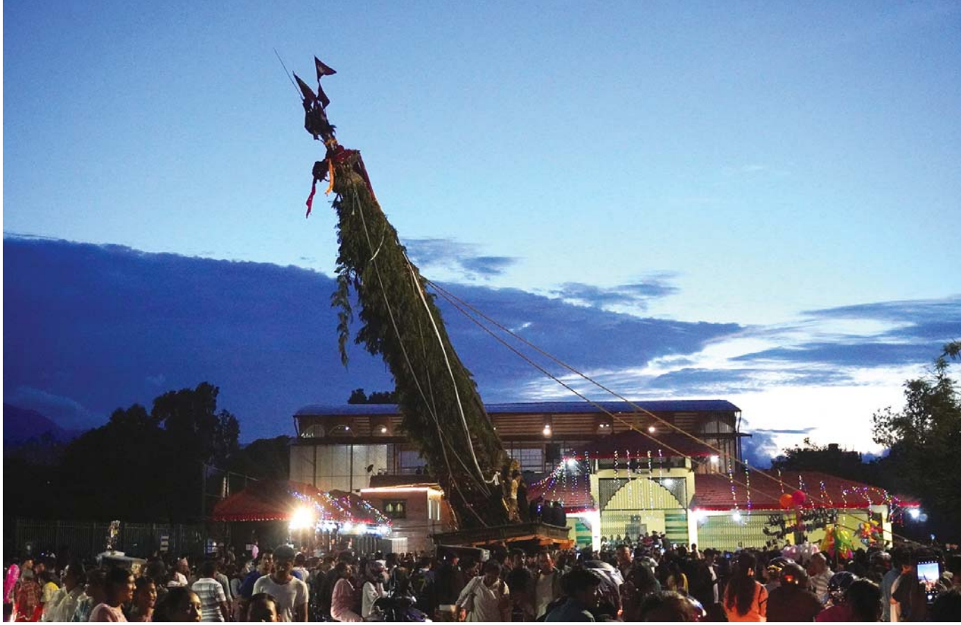
रातो विहीबार लानखेलबाट जावलाखेल पुऱ्याइएको रातो मच्छिन्द्रनाथको रथ। हरेक वर्ष रातो मच्छिन्द्रको रथलाई जावलाखेलको ललितमण्डपमा पुऱ्याएको मच्छिन्द्रनाथ चार दिनपछि भोटो देखाइन्छ।

वर्ष ११ अंक १०३ काठमाडौं शनिबार, १९ साउन २०८१ Prabhav National Daily Saturday, August 03, 2024 www.prabhavonline.com पृष्ठ ८ मूल्य रु. ५१-