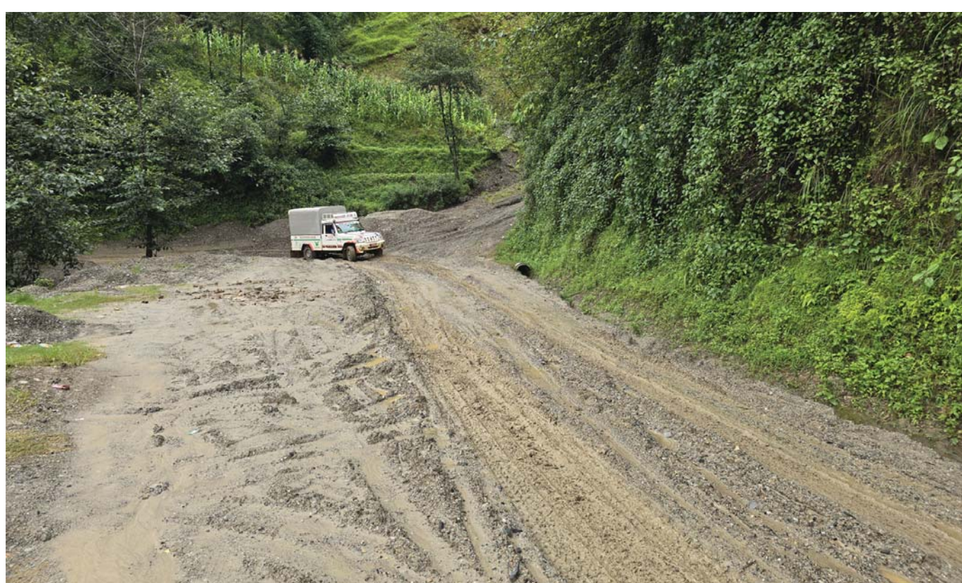
हिलाम्गे राप्ती राजमार्ग | दाङको तुलसीपुरदेखि रुकुम जोड्ने राप्ती राजमार्गअन्तर्गत सल्यान सडकखण्डमा कालोपत्रे भत्किएर कतै खाल्डा त कतै हिलाम्गे भएको सडक। राप्ती राजमार्गको दर्जनौं स्थानमा सडक हिलाम्गे हुँदा सवारीसाधन र यात्रु दुवै मारमा पर्ने गरेका छन्।