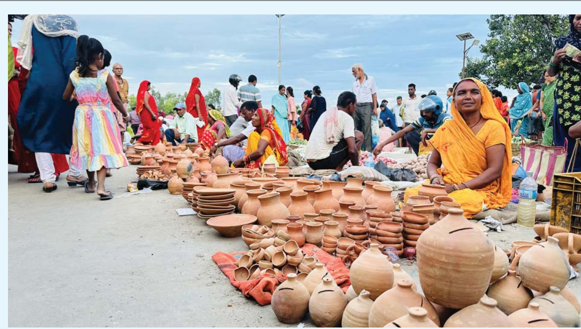
ग्राहकको प्रतीक्षा | सर्लाहीको मलंगवा-९ स्थित जनसागर बजारमा माटोबाट निर्मित सामग्री बिक्रीका लागि ग्राहकको प्रतीक्षामा बसेकी व्यापारी ।