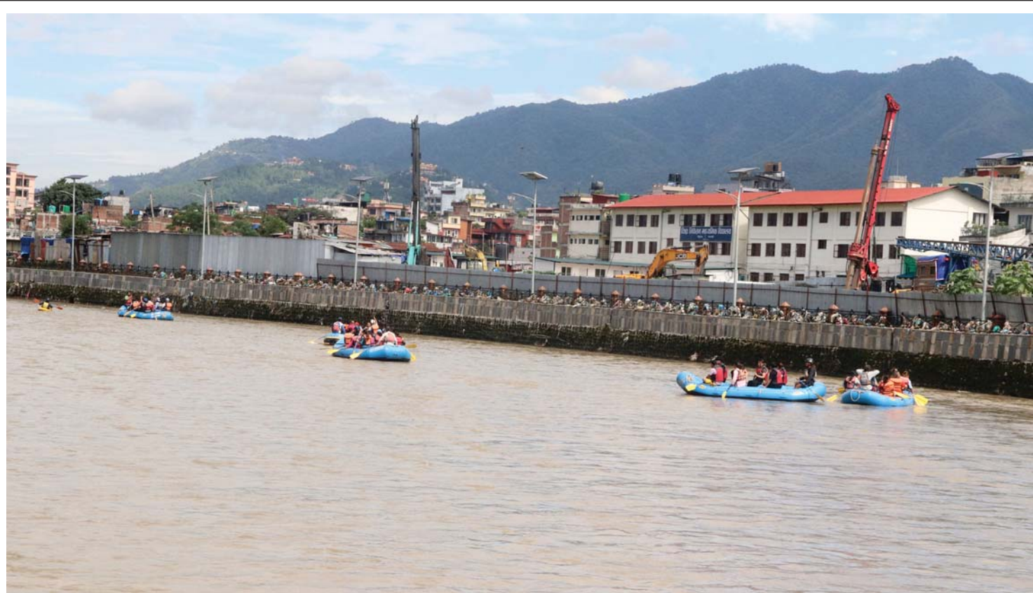
बागमतीमा नेपाल नदी संरक्षण संस्था र फ्रेन्ड्स क्लब कुपोन्डोलले शनिबार बागमती नदीमा कुपोन्डोलबाट गरेको जलयात्रामा सहभागीहरू ।