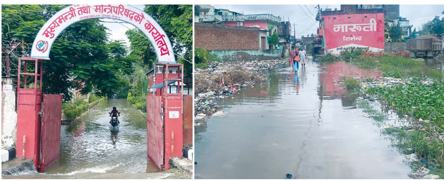
मुख्यमन्त्री कार्यालय नै जलमग्न सोमबार रातिदेखि परेको अतिरिक्त वर्षापछि जलमग्न जनकपुरधामस्थित मधेश प्रदेशका मुख्यमन्त्री तथा मन्त्रिपरिषदको कार्यालय र प्रदेशको राजधानी जनकपुरधाम उपमहानगरपालिका-१४ रजौलको जलमग्न अवस्था ।