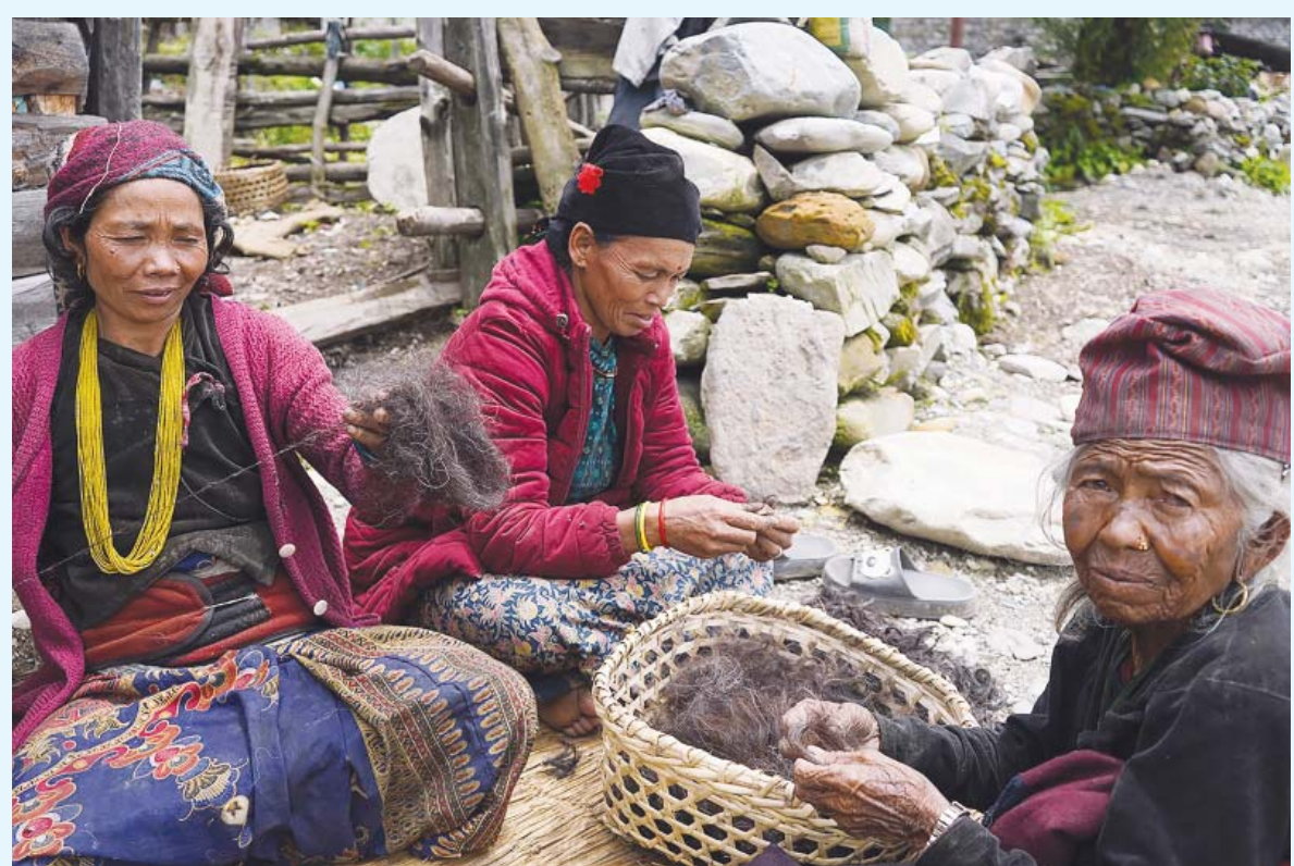
भेडाको डोरपाटन शिकार आरक्षको पाखाथरका महिलाहरू भेडाको ऊनबाट धागो बनाउँदै । भेडाको ऊनबाट काम्पो, हरदुल्लोलागायत ऊनजस्तो सामग्री बनाउने गर्दछन् ।