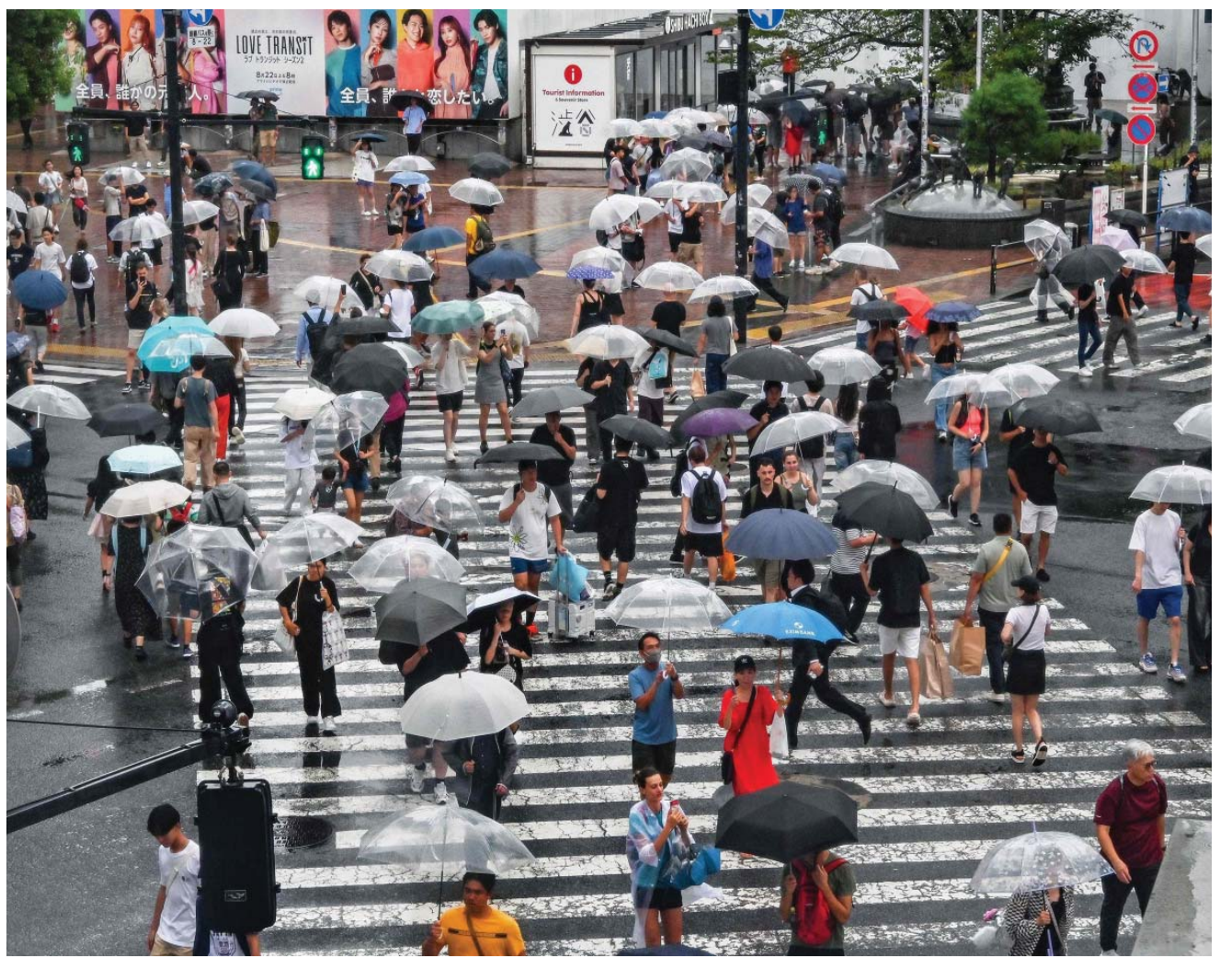
मध्य टोकियोको शिबुया कसिडमा वर्षाबाट जोगिन छाता ओढेर हिँड्दै गरेका पैदलयात्रीहरू। टाइफुन एम्पल जापानको राजधानी नजिक पुगेको बताइएको छ।

वसमा एक युवतीमाथि भएको भयानक सामूहिक बलात्कार र हत्यासँग तुलना गरेको छ। ती महिला महिलाविरुद्ध यौन हिंसाको सामना गर्न सामाजिकरूपमा रूढिवादी मुलुकको असफलताको प्रतीक बनिन्। उनको मृत्युपछि दिल्ली र अन्य स्थानमा ठूलो मात्रामा कहिलेकाहीँ हिंसात्मक प्रदर्शनहरू भए। दवाबमा सरकारले बलात्कारीहरूका लागि कठोर सजाय र बारम्बार अपराध गर्नेहरूका लागि मृत्युदण्डको व्यवस्था गरियो। धेरै नयाँ यौन अपराध पनि सुरु भए। यसमा पछ्याउने पनि सामेल छ। साथै, बलात्कारको उजुरी दर्ता गर्न अस्वीकार गर्ने अधिकारीहरूलाई अब जेल सजाय हुनसक्छ। प्रधानमन्त्री नरेन्द्र मोदीले विहीवार महिलाविरुद्ध 'राक्षसी' कृत्य गर्नेहरूलाई तत्काल सजाय दिन माग गरे। 'हाम्रा आमा र दिदीबहिनीमाथि भएको अत्याचारप्रति आक्रोश छ,' उनले भने, 'महिलाविरुद्धका अपराधको शीघ्र छानविन हुनुपर्छ, महिलाविरुद्धको राक्षसी व्यवहारलाई कडा र तत्काल सजाय दिनुपर्छ।' चिकित्सकहरूले स्वास्थ्यकर्मीहरूलाई हिंसाबाट वचाउन केन्द्रीय संरक्षण ऐन, विधेयक लागू गर्न माग गरेका छन्। रासस/एएफपी