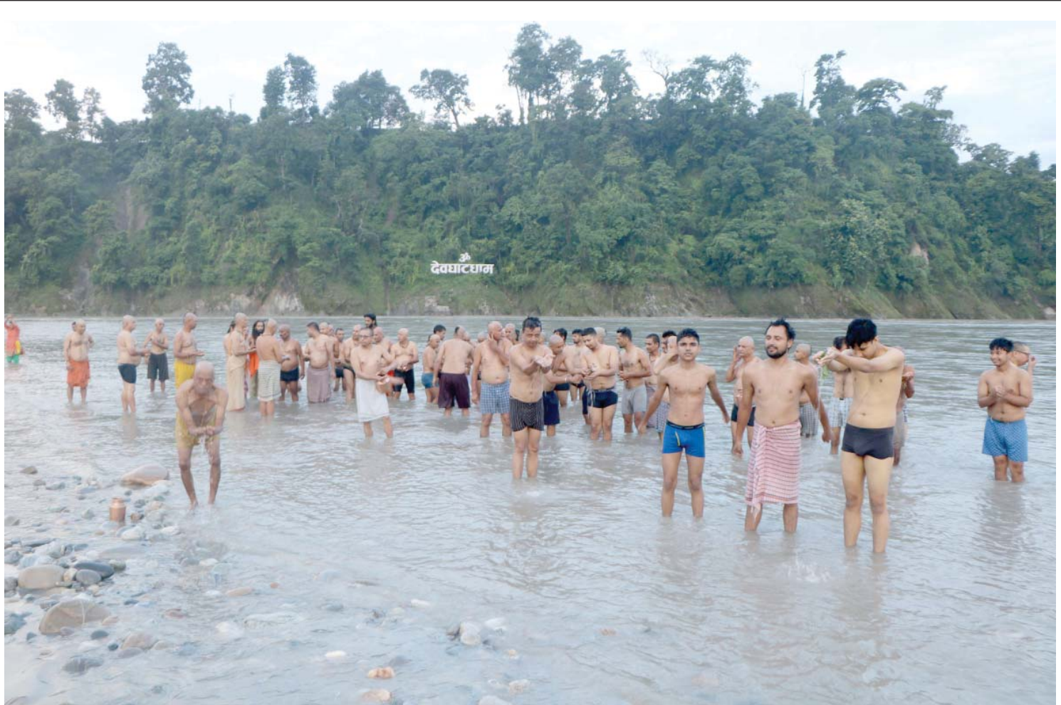
देवघाटमा आवाणी राना

जन्मपूणिमाका दिन सोमबार बिहान पवित्रस्थल देवघाटमा श्रावणी स्नान (गणस्नान) गर्दै पण्डित एवं पुरोहितहरू । स्नानपछि वैदिक रुद्राभिषेक पद्धतिद्वारा जन्म र रक्षाबन्धन धागो मन्त्रने परम्परा रहेको छ ।