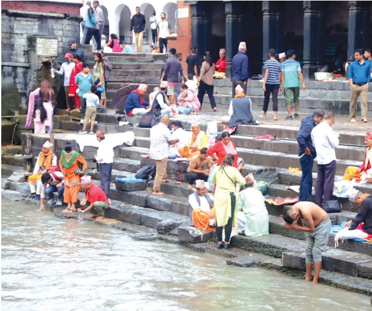
काठमाडौंको पशुपतिनाथ मन्दिरस्थित बागमती नदी किनारामा सोमबार जनैपूर्णिमामा स्नान गरी जनै फेर्दै भक्तजन ।