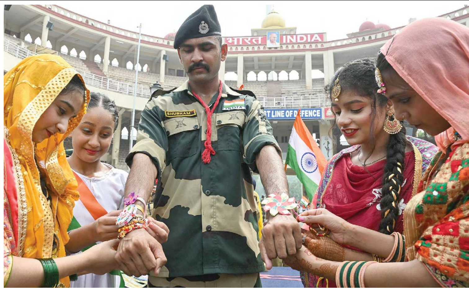
अमृतसरबाट करिब ३५ किलोमिटर टाढा रहेको भारत-पाकिस्तान वागह सीमा चौकीमा हिन्दू पर्व रक्षाबन्धनको अवसरमा भारतीय सीमा सुरक्षाबल (बिएसएफ) का जवानको नाडीमा पवित्र धागो बाँधिदै युवतीहरू।