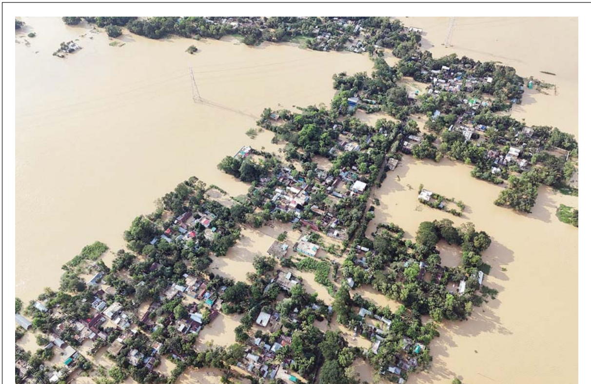
डोनबाट लिइएको बंगलादेशको कुमिल्लाको बाढी प्रभावित गाउँ । बंगलादेशका केही भागमा आएको बाढीका कारण १३ जनाको मृत्यु भएको छ, लाखौं मानिस प्रभावित भएका छन् र धेरै परिवार विस्थापित भएका छन् ।