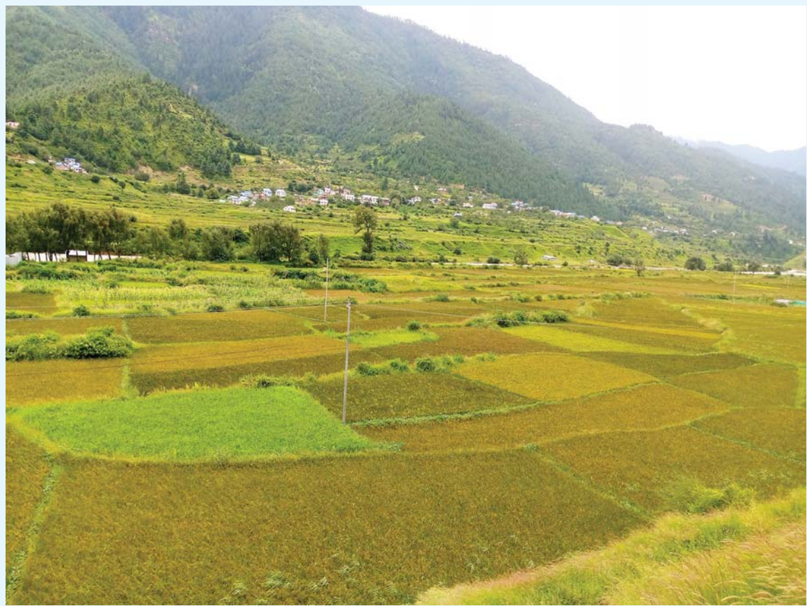
जुम्लाको जम्जुमाको चन्दननाथ नगरपालिका-७ मा रोपिएको मार्सी धानको हरियाली फाँट। अग्लो स्थानमा यहाँ फल्ने मार्सी धानको स्वदेश तथा विदेशमा माग बढ्दो क्रममा रहेको छ।