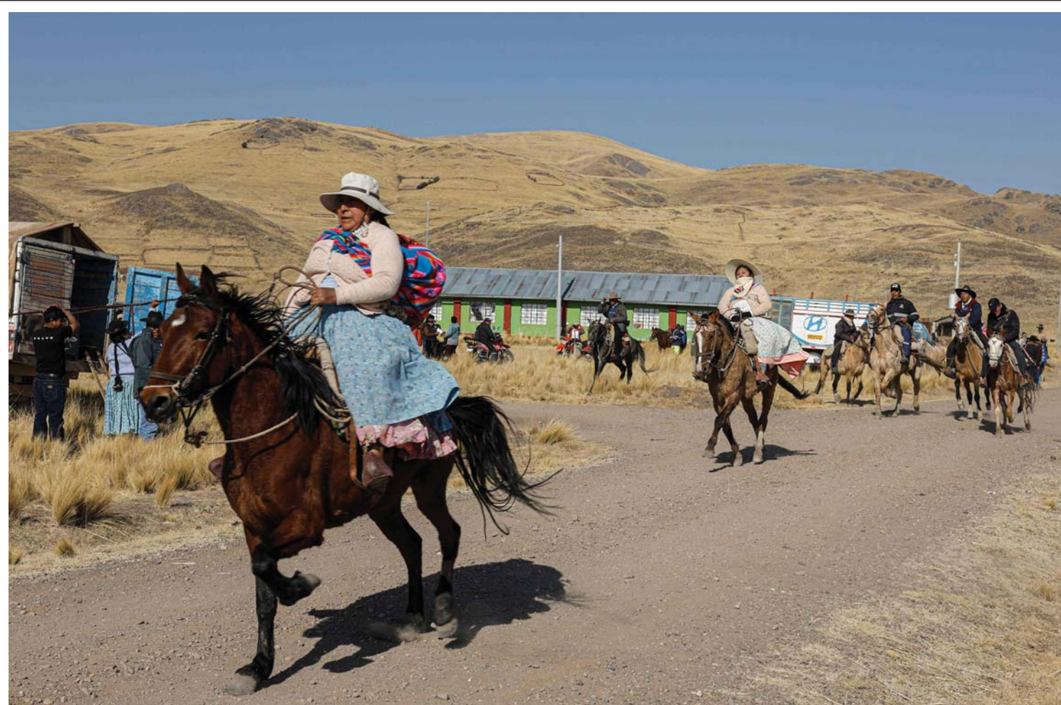
दक्षिणी पेरुको पुनोस्थित अकोरा जिल्लामा अवस्थित मोलिनो समुदायमा भएको घोडा दौडमा भाग लिन आइपगेका आदिवासी आइमारा समुदायका महिला सवारहरू। पुनो समुद्री सतहबाट चार हजार मिटर उचाइमा अवस्थित छ।