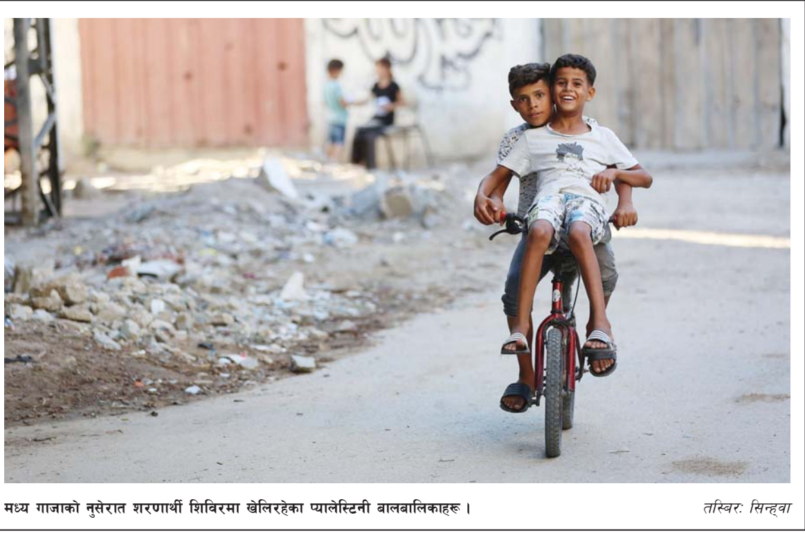
मध्य गाजाको नुसेरात शरणार्थी शिविरमा खेल्नरहेका प्यालेस्टिनी बालबालिकाहरू ।