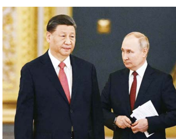
कजानमा शिखर सम्मेलन आयोजना गर्ने तयारी गरेको छ, जसमा क्रेमलिनले आफ्नो प्रभाव विस्तार गर्ने र नजिकको आर्थिक

इन्टरनेशनल इकोनोमिक फोरमका क्रममा चीनका उपराष्ट्रपति हान भोडसँगको भेटमा पुटिनले भने, 'पूर्वसहमतिअनुसार हामी ब्रिक्स शिखर सम्मेलनमा चिनियाँ राष्ट्रपति सी चिनफिङको सहभागिताको अपेक्षा गरिरहेका छौं।' ब्राजिल, रुस, भारत, चीन र दक्षिण अफ्रिकाको संक्षिप्त नाम ब्रिक्स समूहले विश्वको लगभग आधा जनसंख्याको प्रतिनिधित्व गर्दछ र त्यसपछि संयुक्त अरब इमिरेट्स र इरानसहित अन्य प्रमुख उदीयमान अर्थव्यवस्थाहरू समावेश गर्न विस्तारित भएको छ। यस समूहले अक्टोबर २२ देखि २४ सम्म रूसी सहर