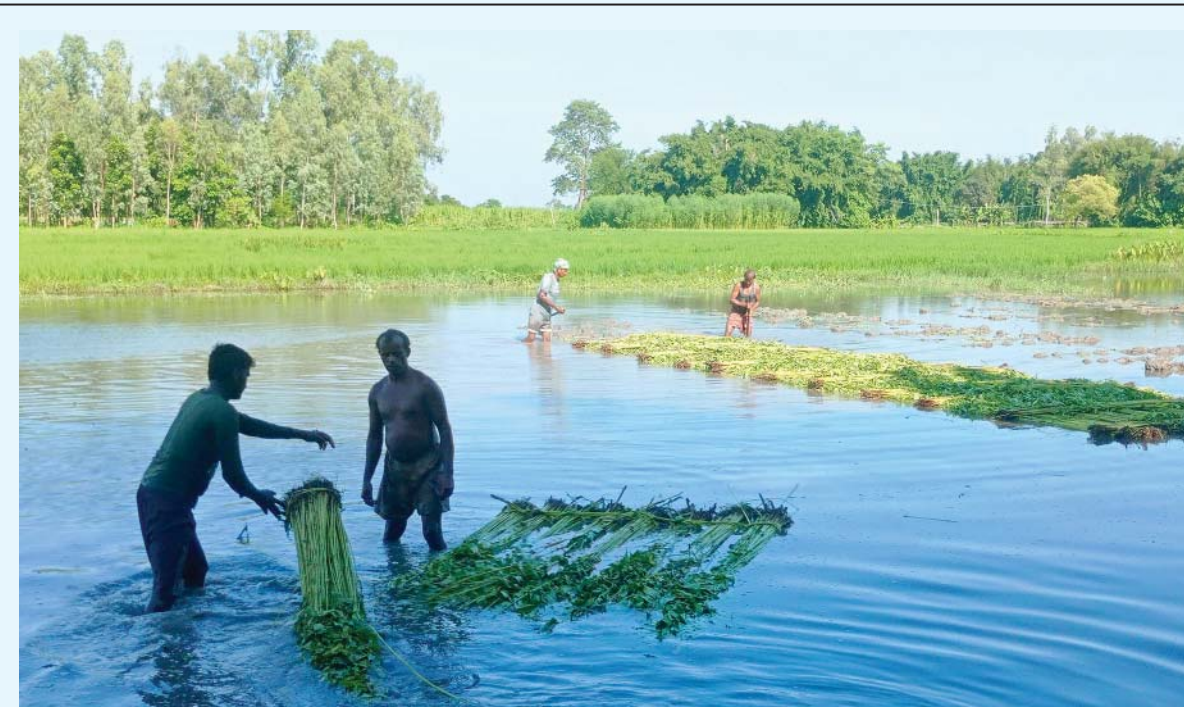
जुट बनाउने सुनसरीको हरिनगर गाउँपालिका-४ स्थित जलाशयमा काँचो जुटलाई दुबाउँदै किसान। हरियो जुटलाई १०/१२ दिन पानीमा दुबाएर राखेपछि जुट केलाउन तयार हुने किसान बताउँछन्।