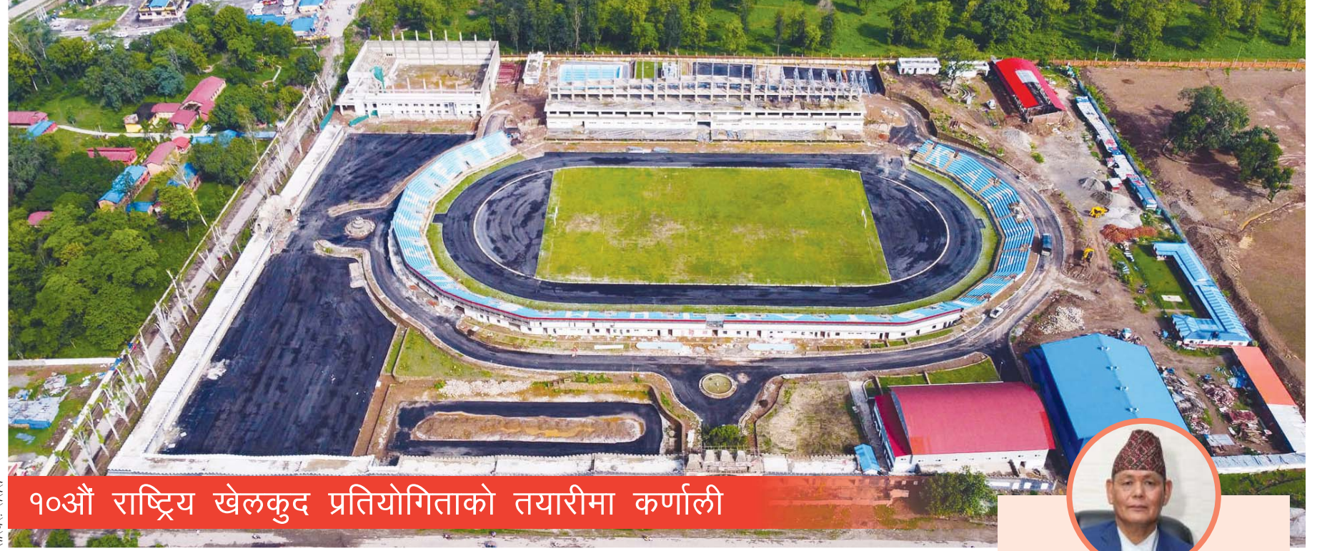
१०औं राष्ट्रिय खेलकुद प्रतियोगिताको तयारीमा कर्णाली