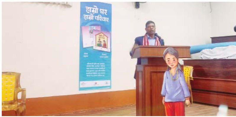
छोराछोरी बालमन्दिरहरूमा राखिने गरे पनि अहिले विपन्न र अशिक्षित परिवारका बालबालिकालाई