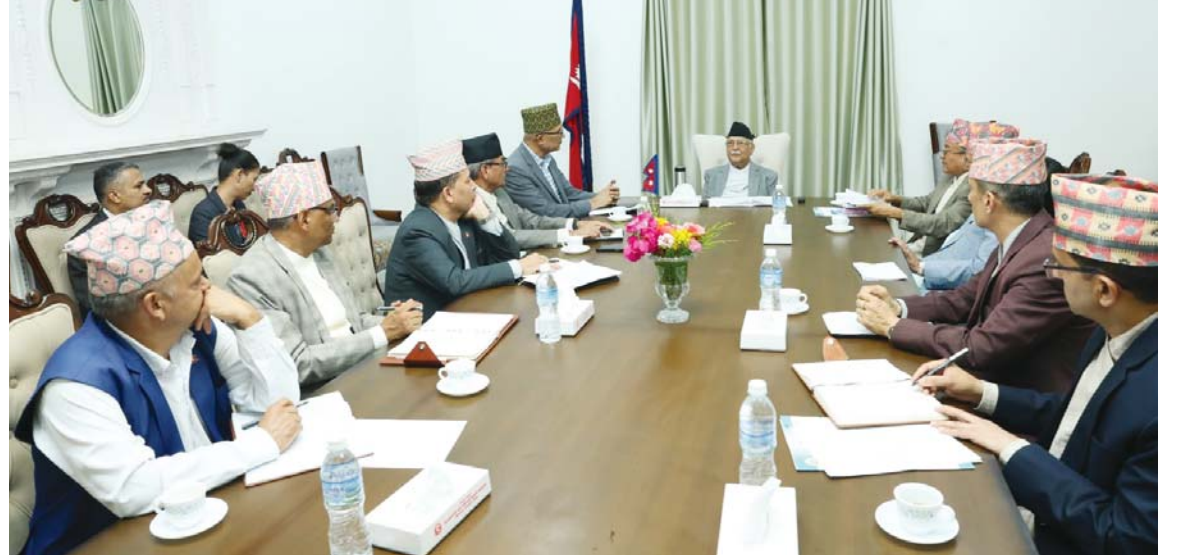
स्थानीय तहको उपनिर्वाचन सम्बन्धमा प्रधानमन्त्री केपी शर्मा ओलीसहित मन्त्रीहरूसँग छलफल आइतबार गर्दै निर्वाचन आयोगका पदाधिकारीहरू।