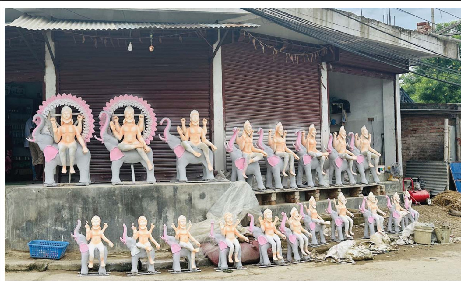
विश्वकर्मा बाबाका मूर्ति विश्वकर्मा पूजालाई लक्षित गर्दै सिरहाको लहान नगरपालिका-५ मा बिक्रीका लागि राखिएका माटोबाट बनेका विश्वकर्मा बाबाका मूर्तिहरू ।