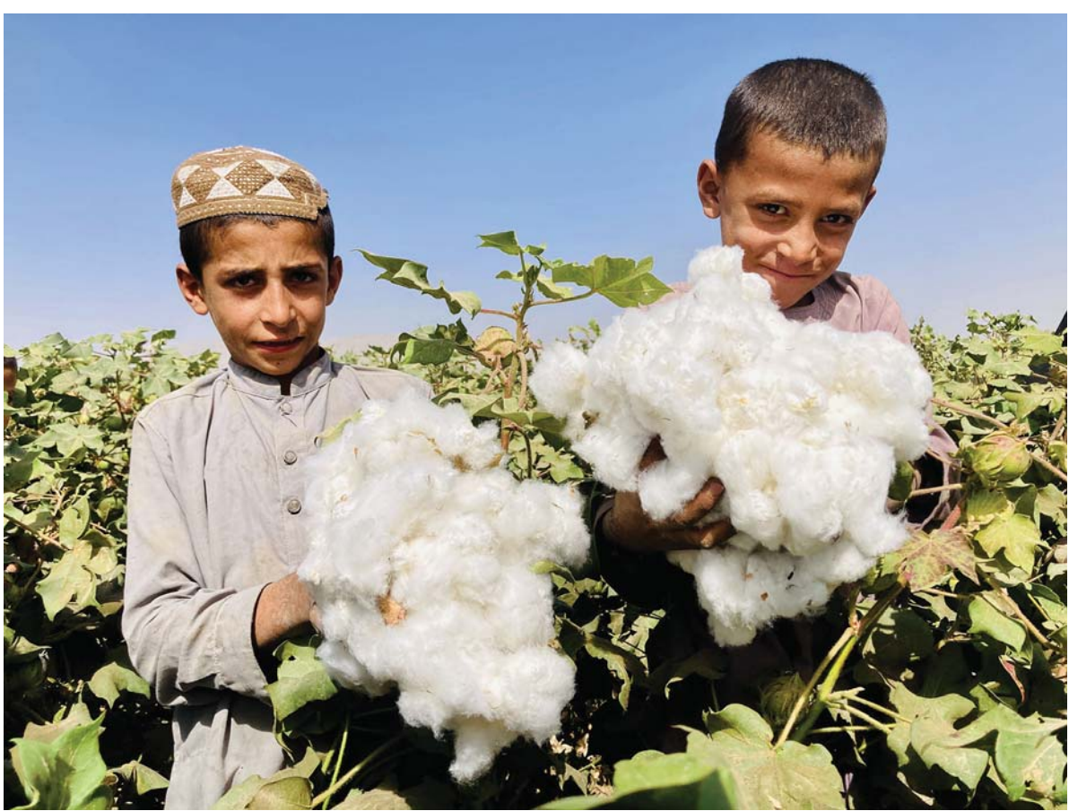
अफगानिस्तानको कान्दाहार प्रान्तको कपास खेतमा भर्खर काटिएको कपास देखाउँदै दुई अफगानी बालक ।