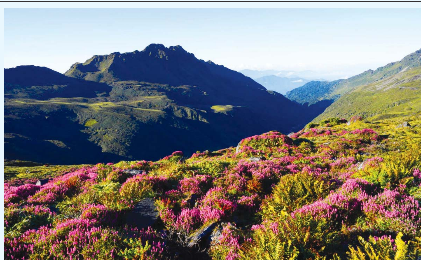
मनमोहक तिमबुङ पोखरी क्षेत्र | हिमाली क्षेत्रमा पाइने विभिन्न प्रजातिका फूलले मनमोहक देखिएको ताप्लेजुडस्थित तिमबुङ पोखरी आसपासको क्षेत्र।