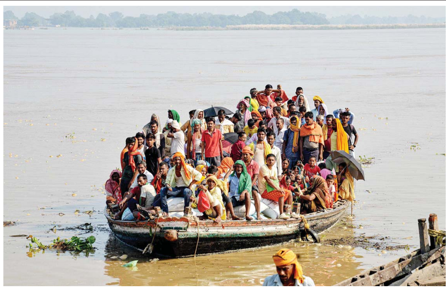
भारतको पटनामा भारी वर्षाका कारण गंगा नदीमा पानीको सतह बढेपछि आफ्ना सरसामानसहित डुंगामा सुरक्षित स्थानतर्फ सधैं बाढी प्रभावित मानिसहरू।

इजरायली रक्षामन्त्री योभ म्यालेन्टले सोमबारको अभियानलाई 'महत्त्वपूर्ण शिखर' भनेका छन्। 'यो हिजबुल्लाहको स्थापनादेखि नै सबैभन्दा कठिन साता हो- परिणामले आफै बताइरहेको छ,' उनले भने, 'साताको सुरुमा गरिएका गतिविधिहरूको परिणामस्वरूप धेरै आतंकवादी घाइते हुँदा सम्पूर्ण एकाइ युद्धबाट बाहिरिए।' इजरायली प्रधानमन्त्री बेञ्जामिन नेतान्याहूले इजरायलले उत्तरमा 'सुरक्षा सन्तुलन' परिवर्तन गर्न काम गरिरहेको बताए। रासस/एएफपी