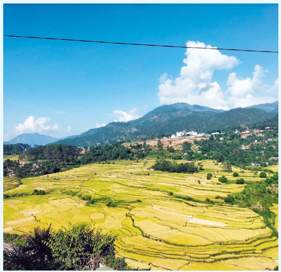
पहेलपुर बैतडीको पाटनमा पाकेर पहेलपुर भएको धानबाली । पाटन धान उत्पादनको पकेट क्षेत्रसमेत हो ।