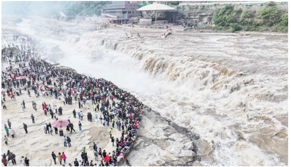
उत्तरी चीनको शान्सी र उत्तरपश्चिम चीनको शान्सी प्रान्तहरूबीचको सिमानामा रहेको पहेंलो नदीमा रहेको हुकोउ फरनाको अवलोकन गर्दै पर्यटक।

उक्त मुद्दामा एक न्यायाधीशले पतिले जबरजस्ती आफ्नी पत्नीसँग यौनसम्बन्ध राख्छ भने त्यसलाई 'एक अपरिचित व्यक्तिले बलात्कार गर्ने कार्यसँग तुलना गर्न सकिदैन' भनी फैसला गरेका थिए। रासस/एफपी