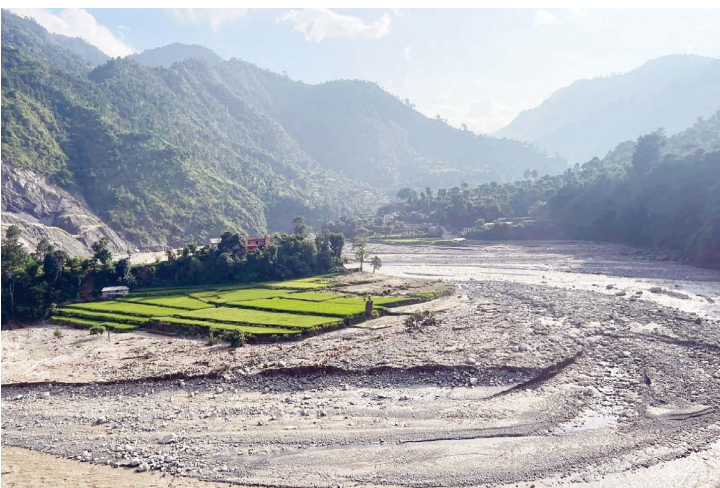
बाढीले बगर बनाएको खेत | रोशी खोलाका शनिवार आएको बाढीले बगाएर बगरमा परिणत काभ्रेपलाञ्चोकको रोशी गाउँपालिका-७ स्थित कटुञ्जे फाँट । तल्लो फाँट र माथिल्लो फाँटमा करिब ३०० रोपनी खेत बगाएको स्थानीय बताउँछन् । बाढीले सोही फाँट नजिक विपी राजमार्गअन्तर्गत चौकीडाँडामा २०० मिटर सडक बगाएको थियो ।