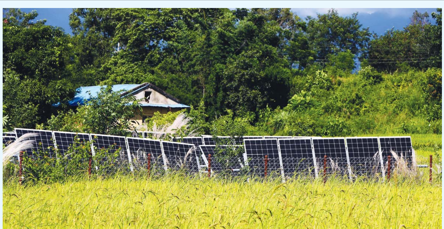
सोलारबाट सिंचाई | दाङको दंगीशरण गाउँपालिका-३ चखौरास्थित खेतमा 'पम्पिंग' गरेर सिंचाइ गर्न राखिएको सोलार।