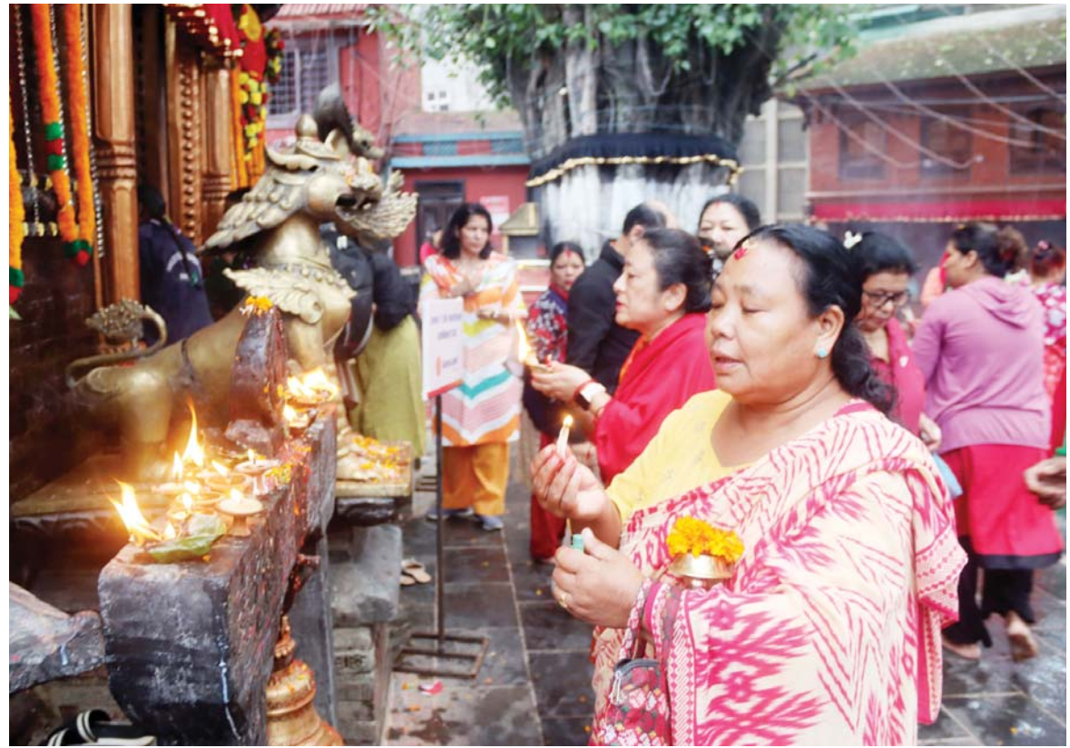
पूजा आराधना | काठमाडौंको मैतिदेवी मन्दिरमा दसैं नवरात्रको दोस्रो दिन शुक्रवार पूजा आराधना गर्दै भक्तजन।