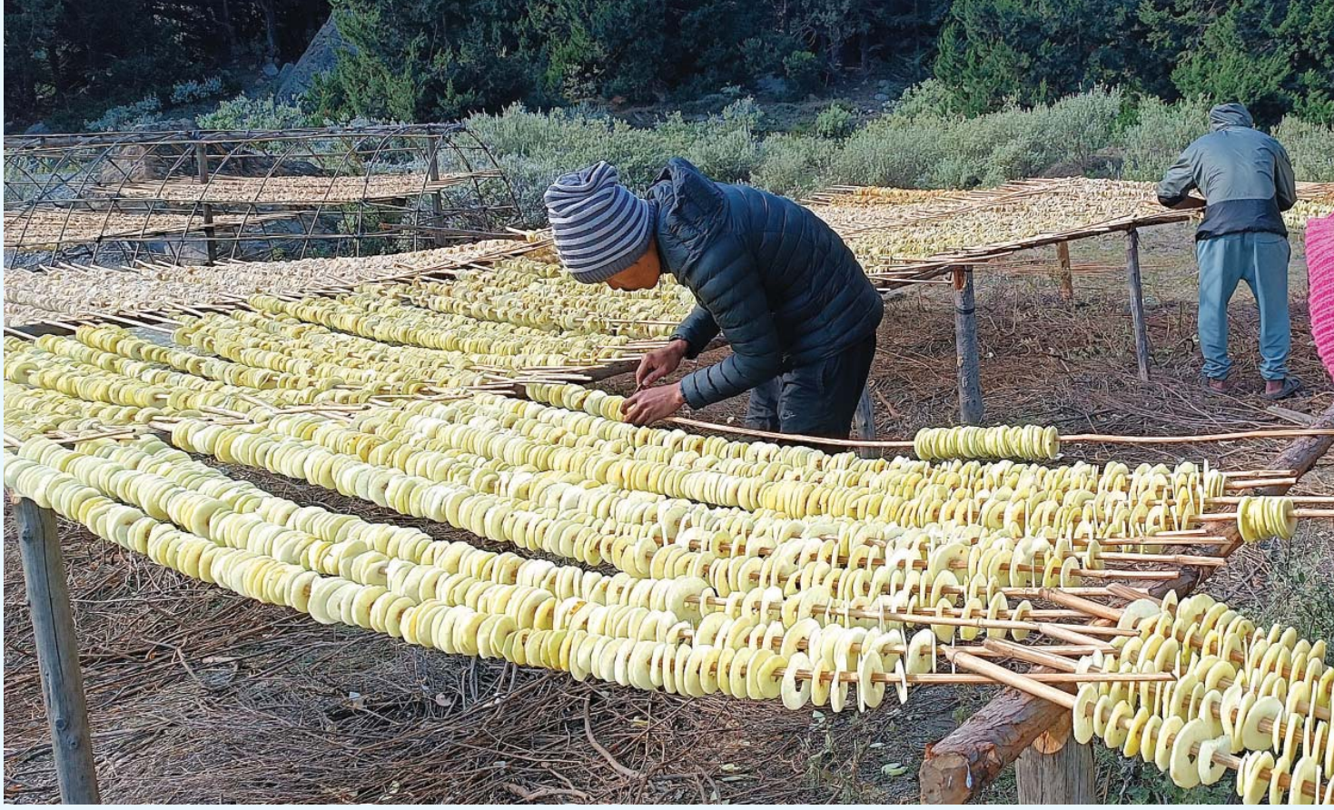
स्याउको सुकुटी - मुस्ताडमा स्याउको सिजन सुरु भएसँगै स्याउबाट बन्ने कोसेलीका विभिन्न परिकारमध्ये स्याउको सुकुटी बनाउँदै कृषक। स्याउको सुकुटीलाई आन्तरिक तथा बाह्य पर्यटकले कोसेलीको रूपमा लैजाने गरेका छन्।