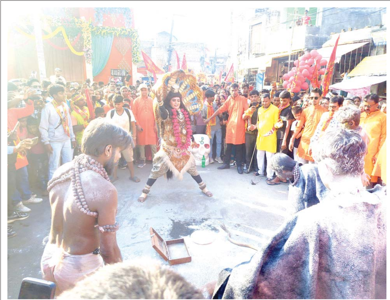
नटराज नृत्य | महोत्तरी जिल्लाको सदरमुकाम जलेश्वरमा बुधवार दुर्गा पूजाको अवसरमा निकालिएको कलश शोभायात्रामा भगवान् शिव, माता पार्वती र उनका दूत भूतसहित नटराज नृत्य प्रस्तुत गर्दै ।