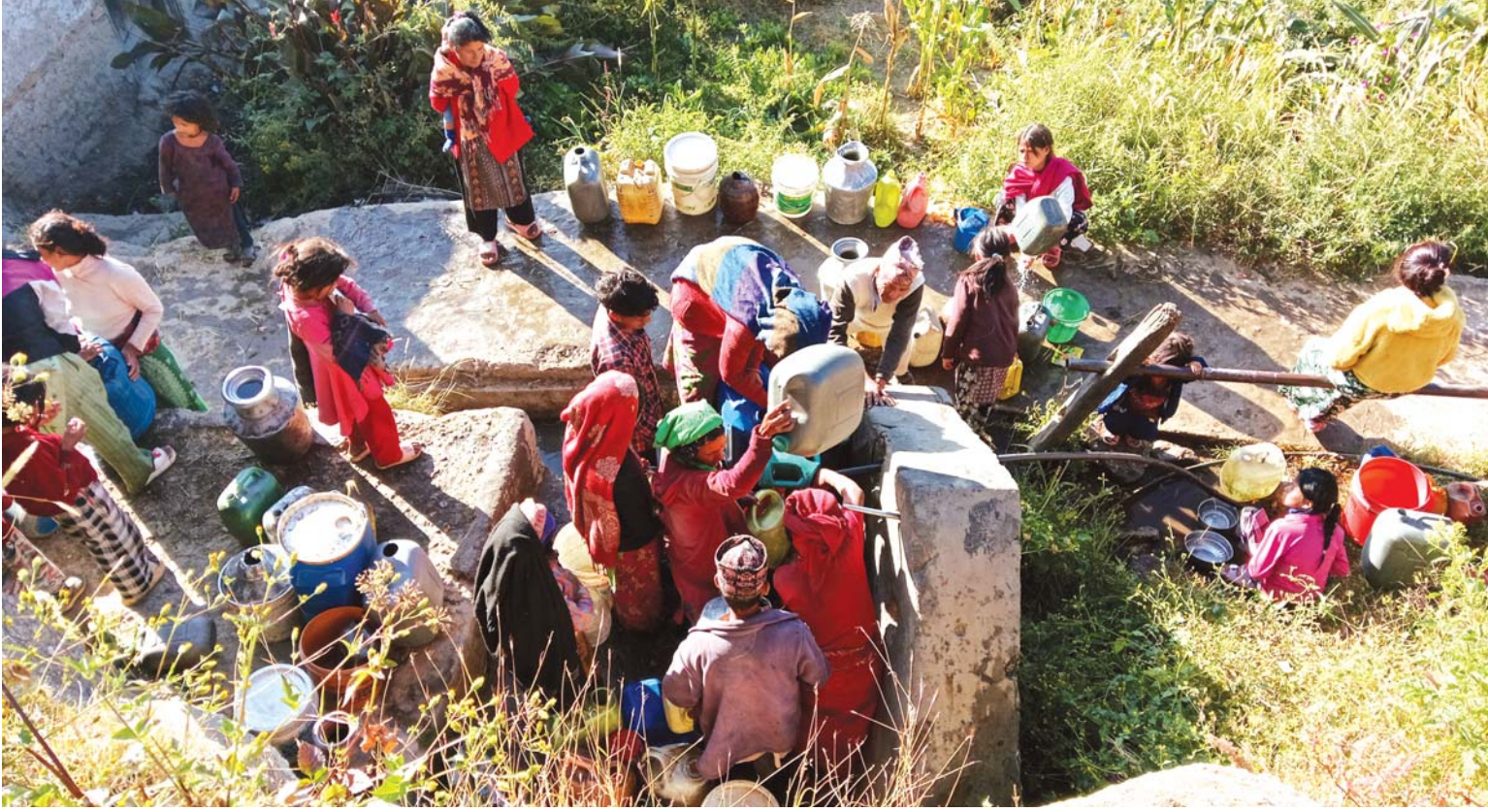
जुम्लाको तिला गाउँपालिका-१ स्थित रारा गाउँका स्थानीय खानेपानीका लागि धारामा पालो कुर्दै । यो गाउँमा स्थानीय पिउने पानीको समस्याले पीडित छन् ।

वर्ष ११ अंक १७२ काठमाडौं मंगलबार, २९ असोज २०८१ Prabhav National Daily Tuesday, October 15, 2024 www.prabhavonline.com पृष्ठ ८ मूल्य रु. ५१-