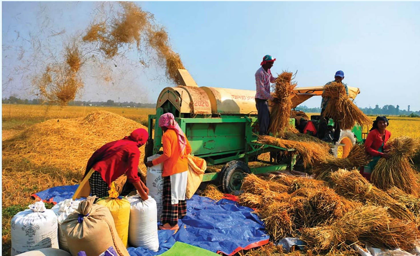
धान कञ्चनपुरको शुक्लाफाँटा नगरपालिका-२ रानीपुरका किसान सोमवार धान शिसिड गर्दै । अहिले यहाँ किसानलाई धान भित्रचाउने चटारो छ ।