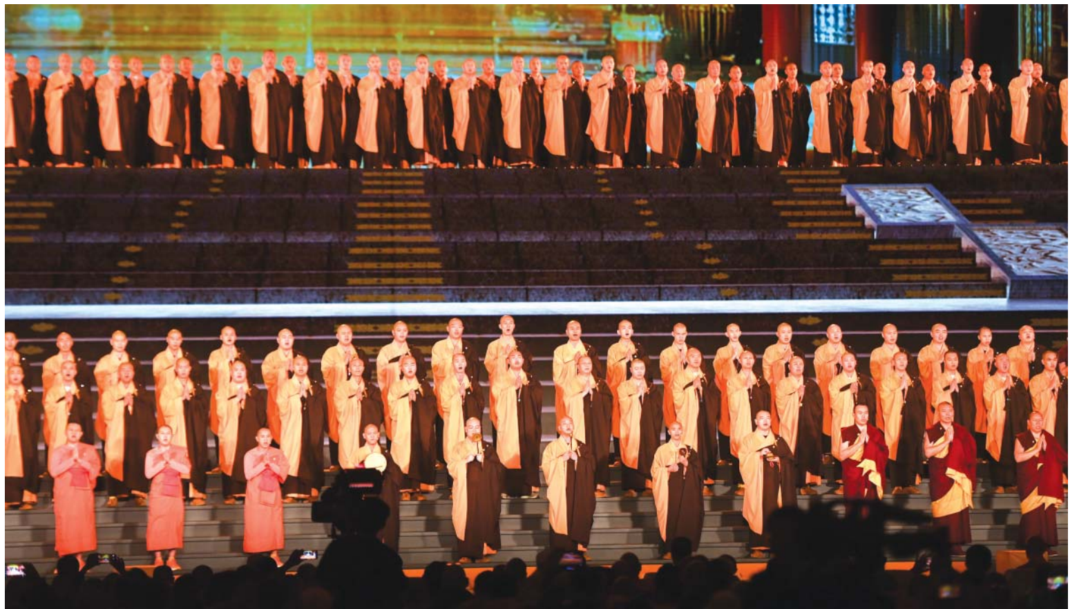
पूर्वी चीनको भेजियाङ प्रान्तको निङ्बोमा आयोजित छैटौं विश्व बौद्ध मञ्चको उद्घाटन समारोह। मंगलबार यहाँ सुरु भएको फोरममा ७२ देश र क्षेत्रका बौद्ध समुदायका करिब ८०० प्रतिनिधि, विज्ञ र विद्वानहरू सहभागी थिए।

'सन् २००६ मा कम्पनीमा आवद्ध भएदेखि म यति धेरै व्यस्त कहिल्यै भएको थिएँनँ, अलादिनका एक कर्मचारीले एएफपीसँग भने, 'यो सबै धेरै खुसीको कुरा भएको छ।' रासस/एएफपी