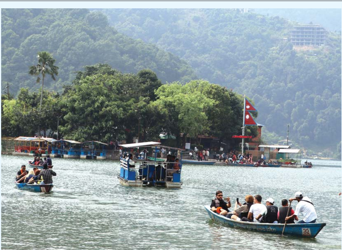
फेवातालमा पर्वतकीय राजधानी पोखरास्थित रामसार सूचीमा सूचीकृत फेवातालमा बुधवार ढुंगा सयर गर्दै आन्तरिक तथा विदेशी पर्यटक। ढुंगा सयर आन्तरिक एवं बाह्य पर्यटकको रोजाइमा पर्ने गरेको छ।