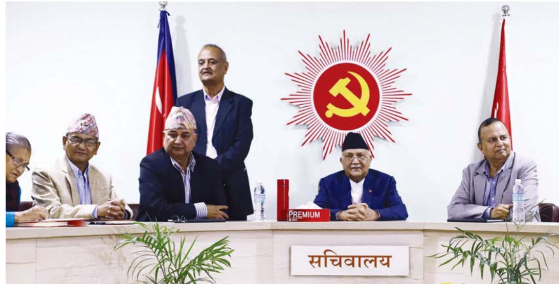
आइतबार पार्टी केन्द्रीय कार्यालयमा बसेको सचिवालय बैठकमा एमाले अध्यक्ष केपी शर्मा ओलीसहित शीर्ष नेताहरू ।

काठमाडौं- नेकपा एमालेमा केपी शर्मा ओलीको 'बा' प्रवृत्ति काँग्रेसको नै छ । यही बा प्रवृत्तिको कारण 'केपी बा' पार्टीको मन्त्रजस्तै बनिसक्यो । १०