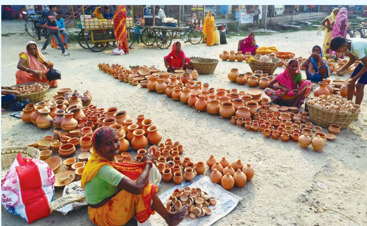
तिहारको दीपावली तथा छठ पर्व नजिकिँदै गर्दा महोत्तरी जिल्लाको पिपरा गाउँपालिका-४ स्थित हटियामा माटाका सामग्री दियो, पाला, व्यापार, कलशलागायत बिक्रीका लागि ग्राहकको प्रतीक्षा गर्दै महिला व्यापारी।