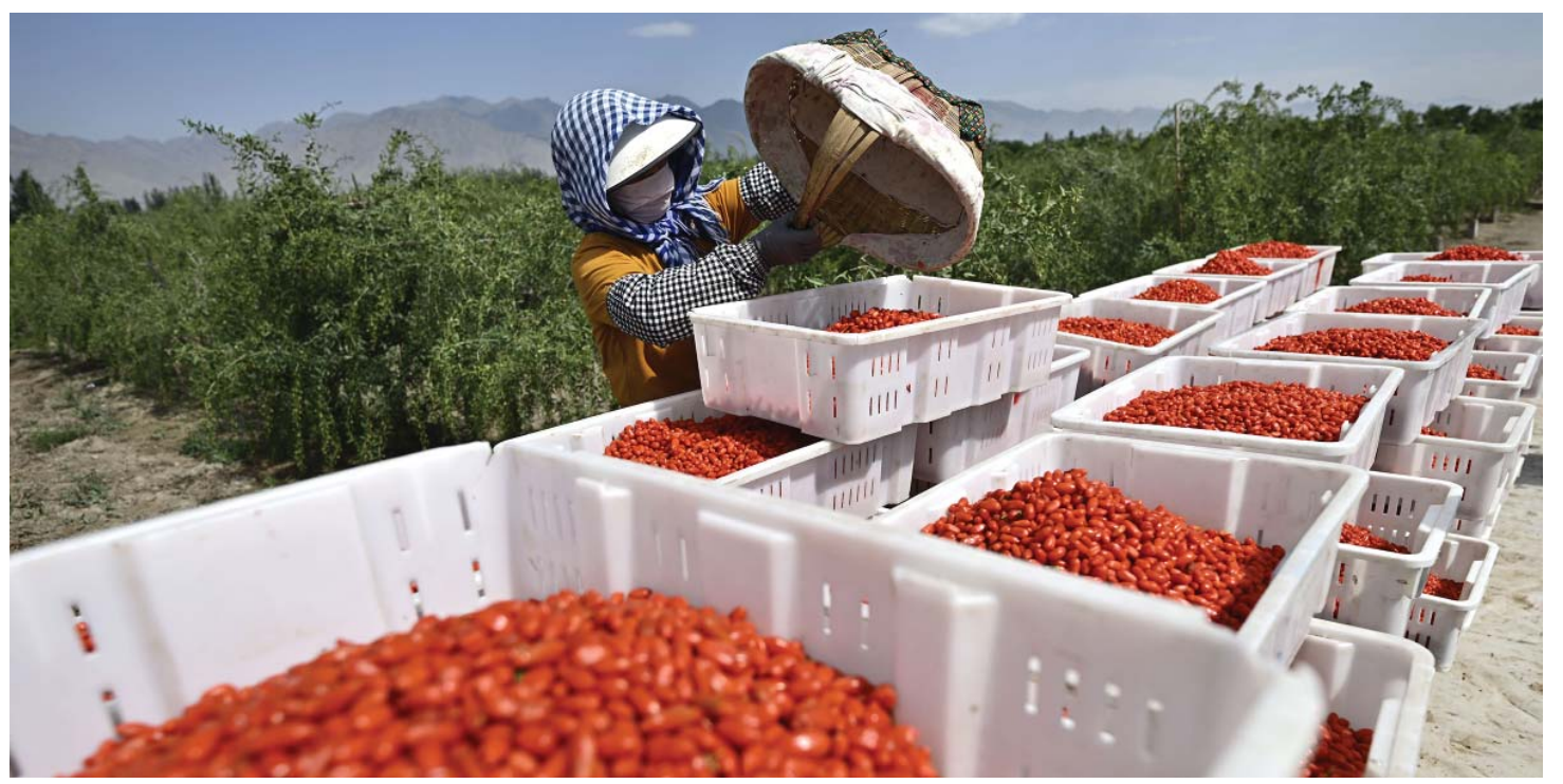
उत्तरपश्चिम चीनको मिजिया हुई स्वायत्त क्षेत्रको हेलान पर्वतको पूर्वी फेदमा रहेको गोजी फार्ममा कटनी गरिएको गोजी जामुन बक्समा प्याकिङ गर्दै एक कामदार।