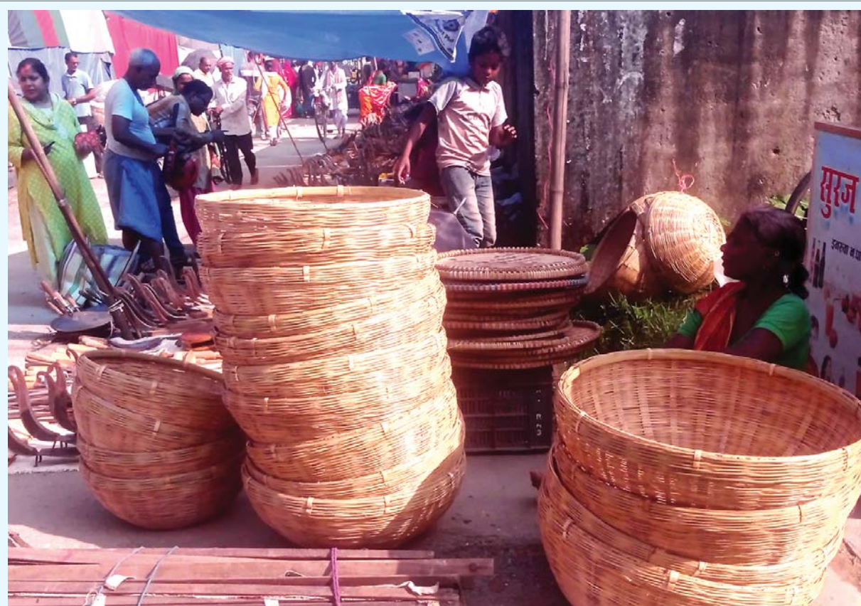
छठका लागि बाँसका टकी सुनसरीको इनरुवास्थित सोमबारे हट्टियामा छठका लागि बिक्री गर्न राखिएका बाँसबाट निर्मित ढकीलगायतका सामग्री। ढकीलगायतका सामग्री स्थानीय बजारमा २५० देखि ३५० रुपैयाँसम्ममा बिक्री हुने व्यापारी बताउँछन्।