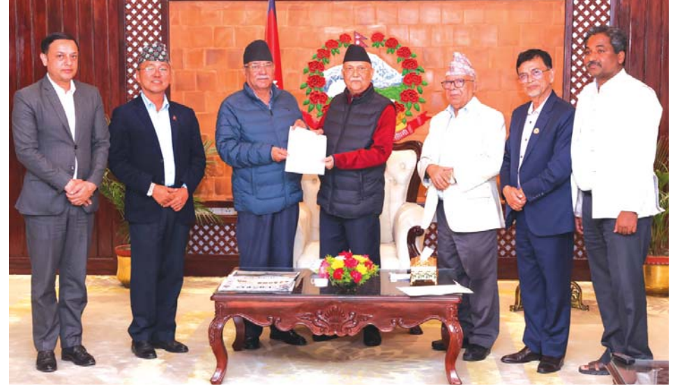
सोमबार प्रधानमन्त्री केपी शर्मा ओलीलाई जापानपत्र बुझाउँदै माओवादी केन्द्रका अध्यक्ष पुष्पकमल दाहाललगायत विपक्षी दलका नेताहरू।