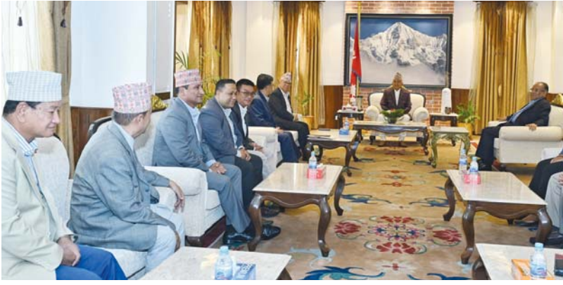
राष्ट्रपति भवन शीतल निवासमा बुधवार राष्ट्रपति रामचन्द्र पौडेललाई भेट्न पुगेका प्रतिपक्षी दलका नेताहरू ।