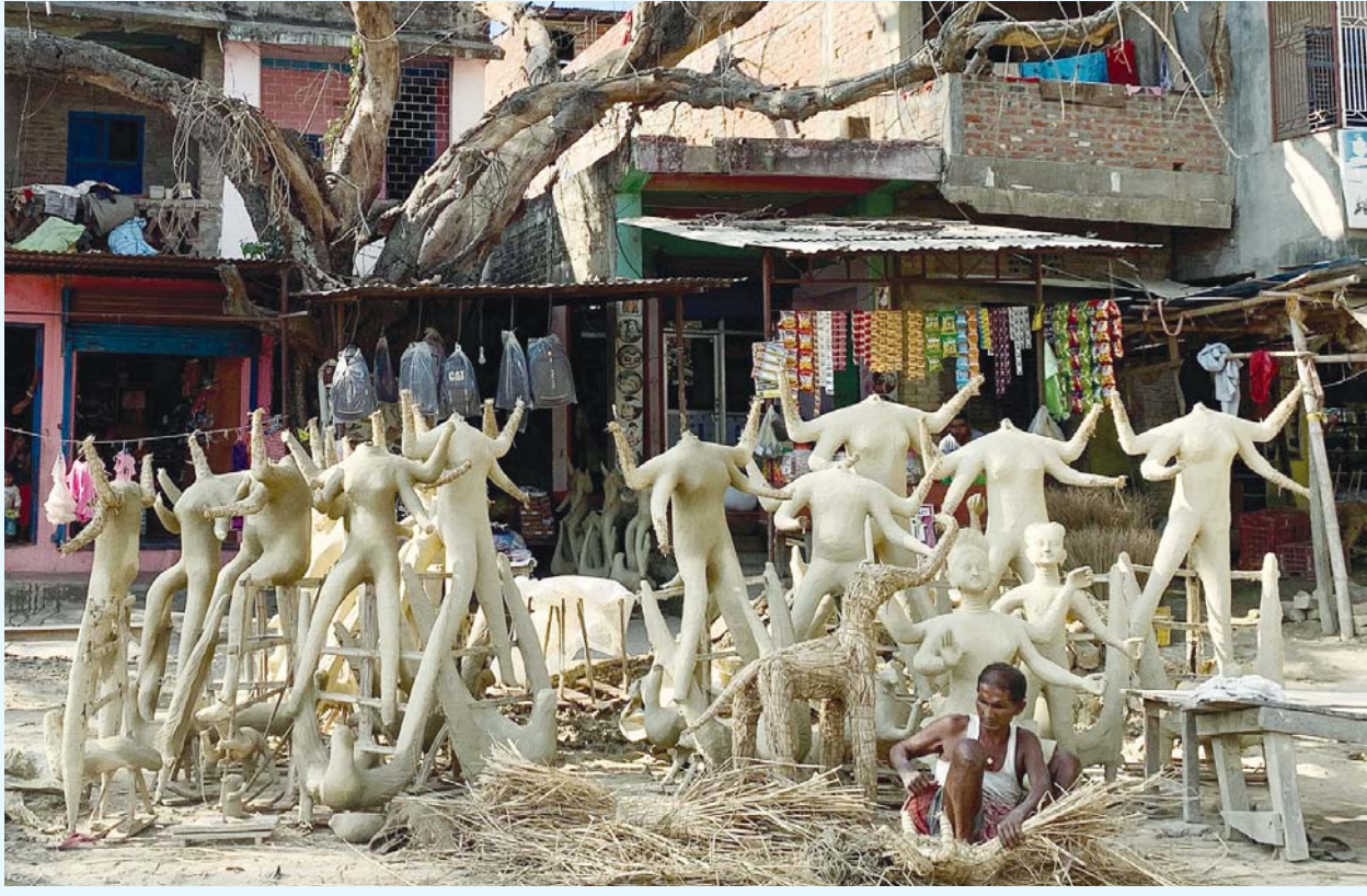
लक्ष्मी कमाउन धनुषाको विदेह नगरपालिका-६ तिनकौरिया चोकमा लक्ष्मी पूजामा बिक्रीका लागि मूर्ति तयार गर्दै मूर्तिकार । यहाँका मूर्तिकारहरूले लक्ष्मी पूजाको अवसरमा मूर्ति बनाएर आर्थिक उपाजन गर्ने गर्दछन् ।