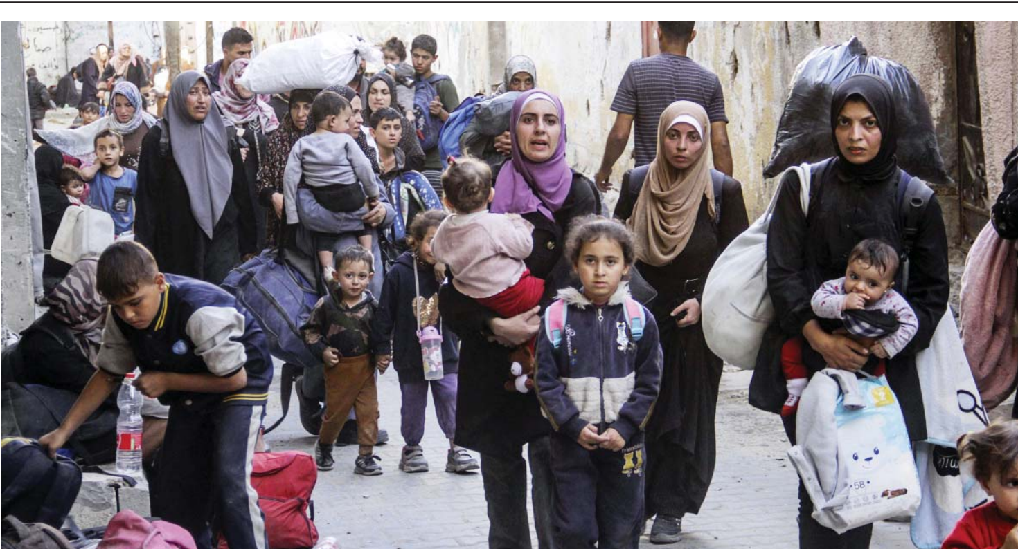
युद्धको पीडा | इजरायली सेनाद्वारा बेइट लाहिया सहर छोड्न बाध्य पारिएपछि उत्तरी गाजा पट्टीस्थित जबलिया शरणार्थी शिविरमा पुगेका मानिसहरू।