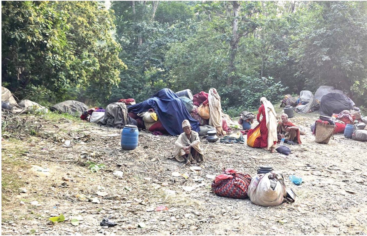
राउटे समुदाय तिहारको समय पारेर सुर्खेतको वीरेन्द्रनगर नगरपालिकास्थित रानीघाटमा बसाई सरेर आएका लोपोन्मुख राउटे समुदाय। फिरन्ते जीवन बिताउने राउटे समुदाय मौसम परिवर्तनसँगै बसाई सरेर गर्दछन्।