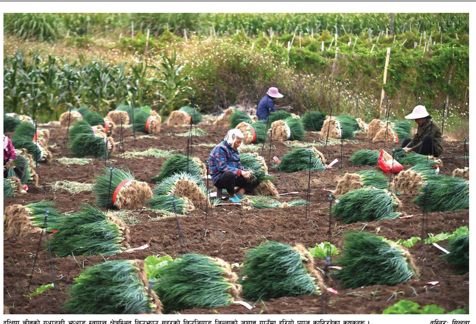
दक्षिण चीनको गुआङ्दोङ्ग फुआङ्ग स्वायत्त क्षेत्रस्थित लिउझाङ्ग सहरको लिउजियाङ्ग जिल्लाको जुशान गाउँमा हरियो प्याङ्ग काटिरहेका कृषकहरू।