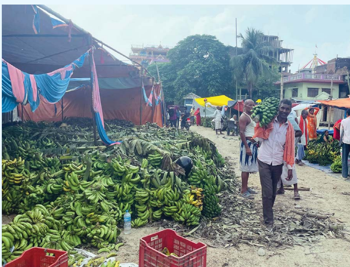
छठको तयारी | महोत्तरीको गौशाला नगरपालिकाको गौशाला बजारमा छठ पर्वका लागि केराको घरी किनमेल गरिँदै ।