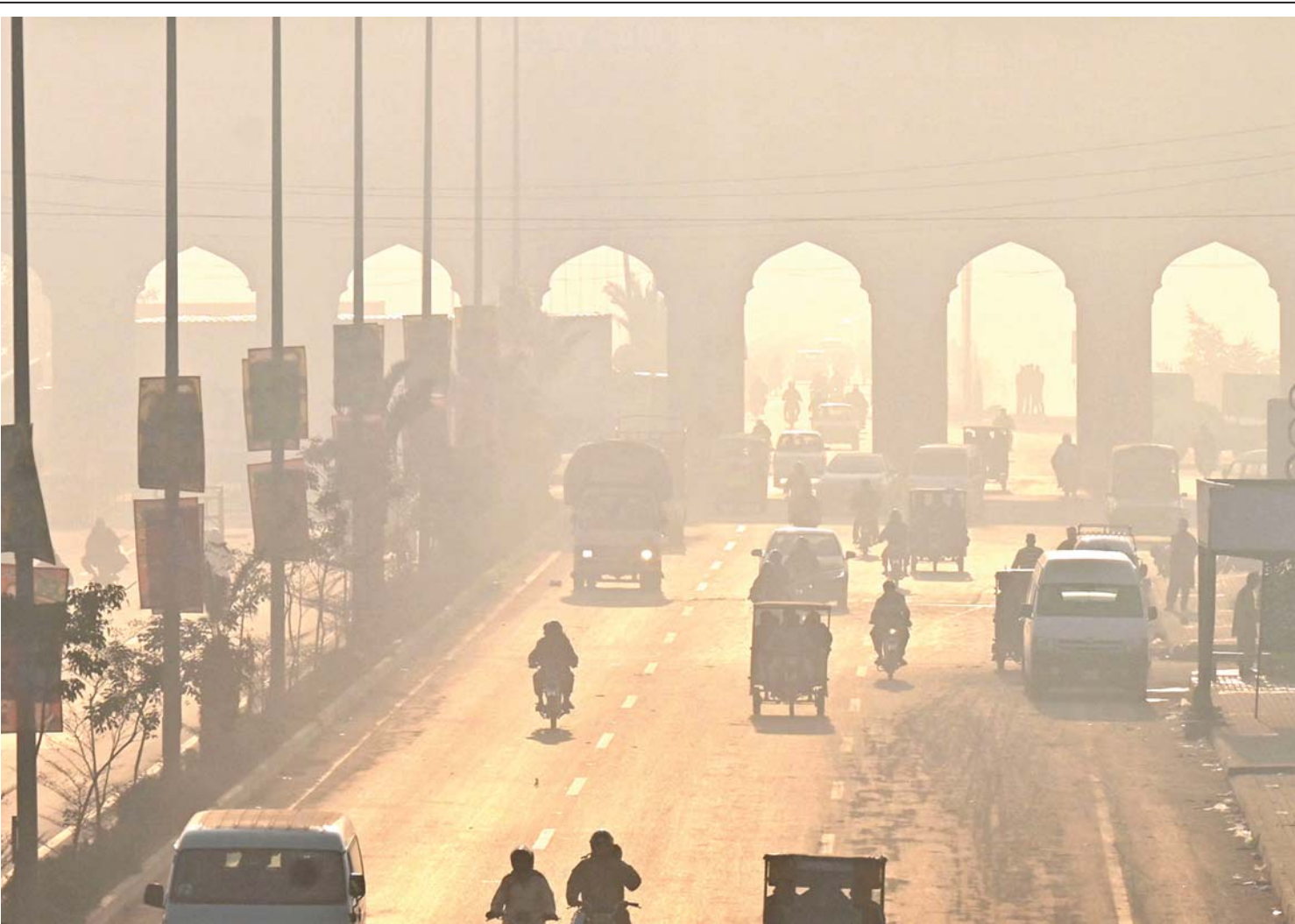
पाकिस्तानको लाहोरमा सोमबार बाक्लो प्रक्षिप्त धुवौले ढाकिएको सडक। प्रदूषणका कारण पछिल्लो समय यहाँको जनजीवन प्रभावित बनेको छ।