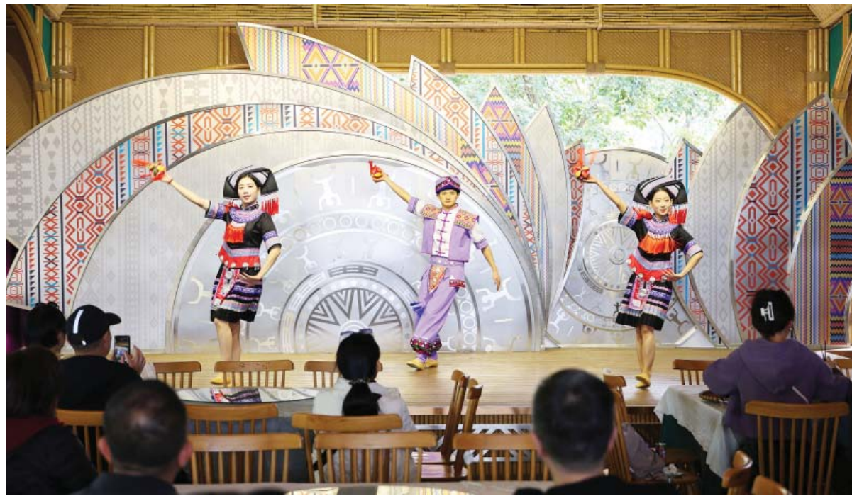
चीन-भियतनाम डेटियान-बान जिओक भरना सीमापार पर्यटन सहयोग क्षेत्रमा बिहीबार प्रस्तुत गरिँदै । दक्षिण चीनको गुआङ्सीको सीमावर्ती सहर चोङ्जुओमा धिनियाँ भागसहितको उक्त भरना सीमापार पर्यटन सहयोग क्षेत्र यस वर्षको अक्टोबर १५ देखि औपचारिक रूपमा सञ्चालनमा आएको हो ।