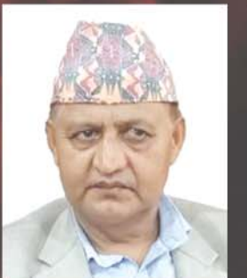
माननीय वेट नारायण आचार्य मुख्यमन्त्री लुम्बिनी प्रदेश