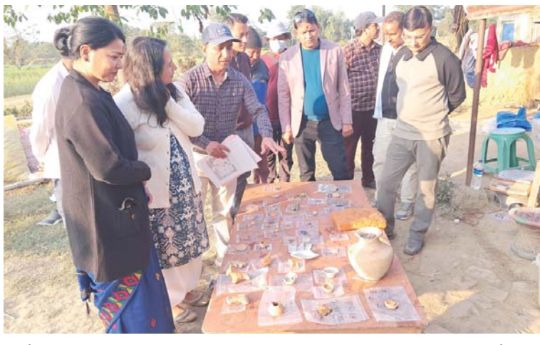
भू-भौतिक अध्ययनमा देखिएका पखाल संरचना प्रमाणित गर्ने थियो। साथै एक