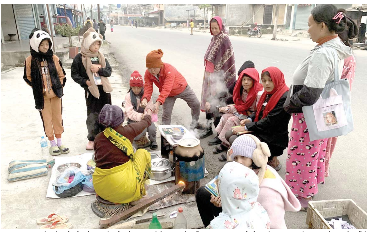
भक्तिका किन्दै विद्यार्थी मोरङको पथरी शनिश्चरे-१ मा रहेका विहानी सत्रमा लाग्ने विद्यालयका विद्यार्थीहरू खाजा खान भक्तिका किन्दै। जाडो याममा खाजाको रूपमा तातो भक्तिका विद्यार्थीको रोजाइमा पर्ने गरेको छ।