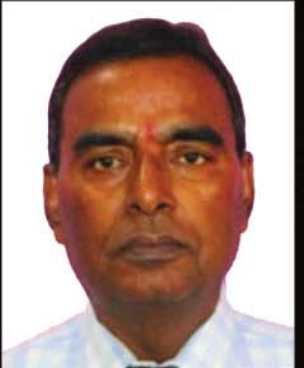
प्रा. डा. पि के भा अर्थशास्त्री