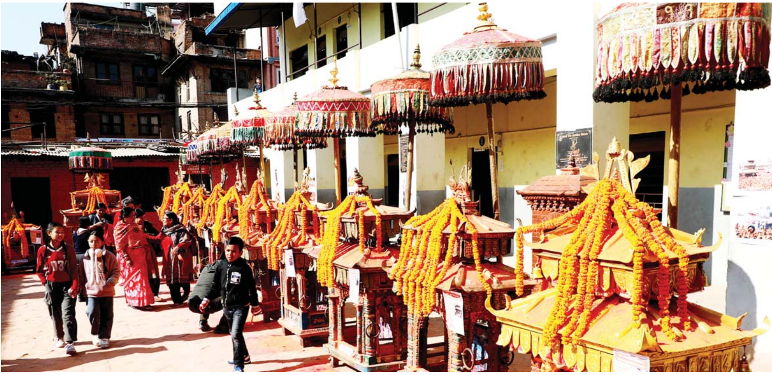
देवताका सट भक्तपुरको मध्यपुर थिमि नगरपालिकाद्वारा आयोजित तीनदिने मध्यपुर महोत्सवका अवसरमा लायक दरवारमा प्रदर्शनी परिसरमा राखिएका बिस्का जात्रामा जात्रा गरिने विभिन्न देवताका खटहरू।