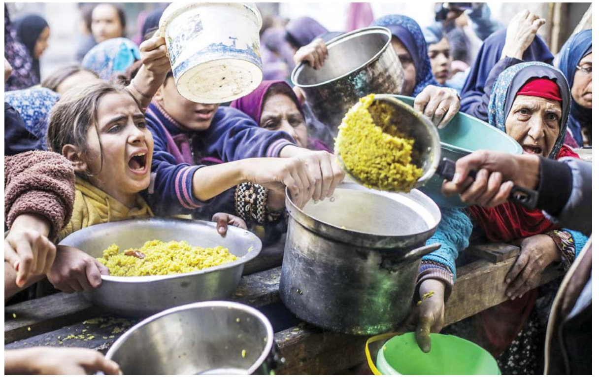
गाजास्थित खाद्य वितरण केन्द्रबाट निःशुल्क खाना लिने प्यालेस्टाइनहरूको भीड।

रहेकाले अहिले वास्तविक लम्बाइ करिब दुई हजार ५०० मिटर रहेको छ। 'आज दुर्घटनाग्रस्त भएको बोर्ड ७३७-८०० विमान एक हजार ५०० मिटरदेखि एक हजार ६०० मिटर लामो धावनमार्गमा अवतरण गर्न सक्छ,' मन्त्रालयका एक अधिकारीले भने, 'धावनमार्गको लम्बाइका कारण दुर्घटना भएको भन्नु अन्तर्राष्ट्रिय विमानस्थलमा जेजु एयरको विमान अवतरणका क्रममा धावनमार्गबाट चिप्लिएर पछालमा ठोक्किएर आइतबार विमान दुर्घटना भएको थियो।