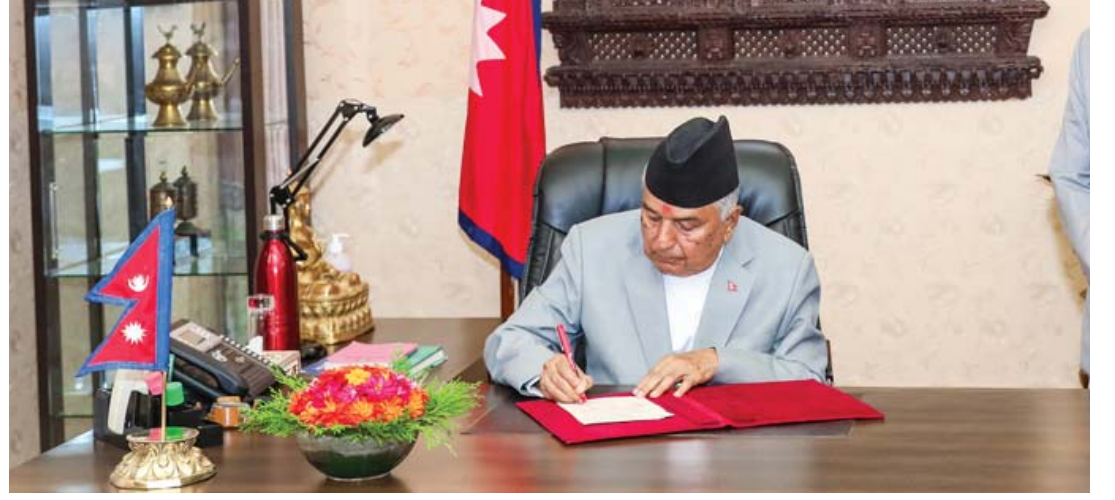
सहकारीसम्बन्धी अध्यादेश प्रमाणीकरण गर्दै राष्ट्रपति रामचन्द्र पौडेल ।

काठमाडौं- सहकारीमा डुबेको बचत रकम फिर्ता गर्नेगरी सरकारले ल्याएको अध्यादेश राष्ट्रपति रामचन्द्र पौडेलले जारी गरेका छन् । आइतबार अध्यादेश जारी भएसँगै समस्याग्रस्त घोषणा भएको सहकारीहरूलाई पाँच लाख रुपैयाँसम्मका बचतकर्ताको बचत फिर्ता गराउने कानुनी बाटो खुला भएको छ । अध्यादेशमा छ, 'सहकारी संस्था वा दफा १०४ बमोजिम समस्याग्रस्त घोषणा भएको सहकारी संस्थाको सदस्यले जम्मा गरेको पाँच लाख रुपैयाँसम्मको बचत फिर्ता प्राथमिकतामा राखी भुक्तानी गर्ने ।' पाँच लाखभन्दा बढी बचत भए सहकारी संस्थाले एकैपटक भुक्तानी गर्ने