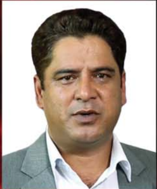
माननीय दामोदर भण्डारी उद्योग मन्त्री