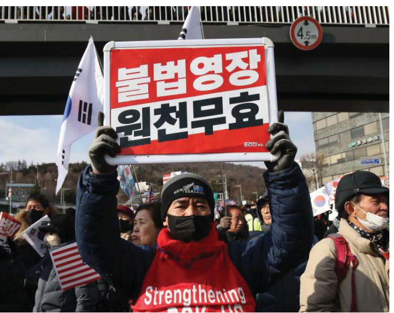
युनलाई पक्राउ गर्न गएको थियो। प्रहरीका २० वटा टोली विहान ८ बजे नै युनको घरमा पुगेका थिए। तर, युनको सुरक्षा दस्ता र सेना प्रहरीसँगै भिड्ने अवस्थामा पुगेपछि प्रहरीले युनलाई पक्राउ गर्न मिसन रोकेको बताएको छ।

सियोल्- प्रहरीले महाभियोगपछि निलम्बित दक्षिण कोरियाका राष्ट्रपति पक्राउ गर्ने प्रहरीको प्रयास विफल भएको छ। करिब छ घण्टा लामो संघर्षपछि दक्षिण कोरियाका निलम्बित राष्ट्रपति युन सुक योललाई पक्राउ गर्ने प्रहरीको कदम रोकिएको छ। युनको सुरक्षामा रहेको सेनाको टोलीले मानव पखाल बनाएर पक्राउ गर्न आएका प्रहरीको बाटो छेकेको कोरियाली समाचार संस्था योन्हापले जनाएको छ। युनको सुरक्षा दस्ता तथा दक्षिण कोरियाली सेनाले प्रहरीलाई रोक्नका लागि बाटोमा सवारीसाधनसमेत तैयारिएको थियो। युनमाथि शक्तिको दुरुपयोग गरेको र सैन्य कानून लागू गर्न खोजेको भन्दै महाभियोग प्रस्ताव संसदमा पुगेको छ। संसदमा महाभियोग प्रस्ताव पुगेपछि उनी निलम्बित भएका थिए। दक्षिण कोरियामा संसदको महाभियोग प्रस्तावको अन्तिम निर्णय संवैधानिक अदालतले गर्छ। तर, अदालतले तीनपटक बोलाउँदा पनि युन अदालतमा उपस्थित नभएपछि उनलाई पक्राउ गर्ने अनुमति दिएको थियो। त्यही अनुमतिको आधारमा प्रहरीको टोली शुकवार